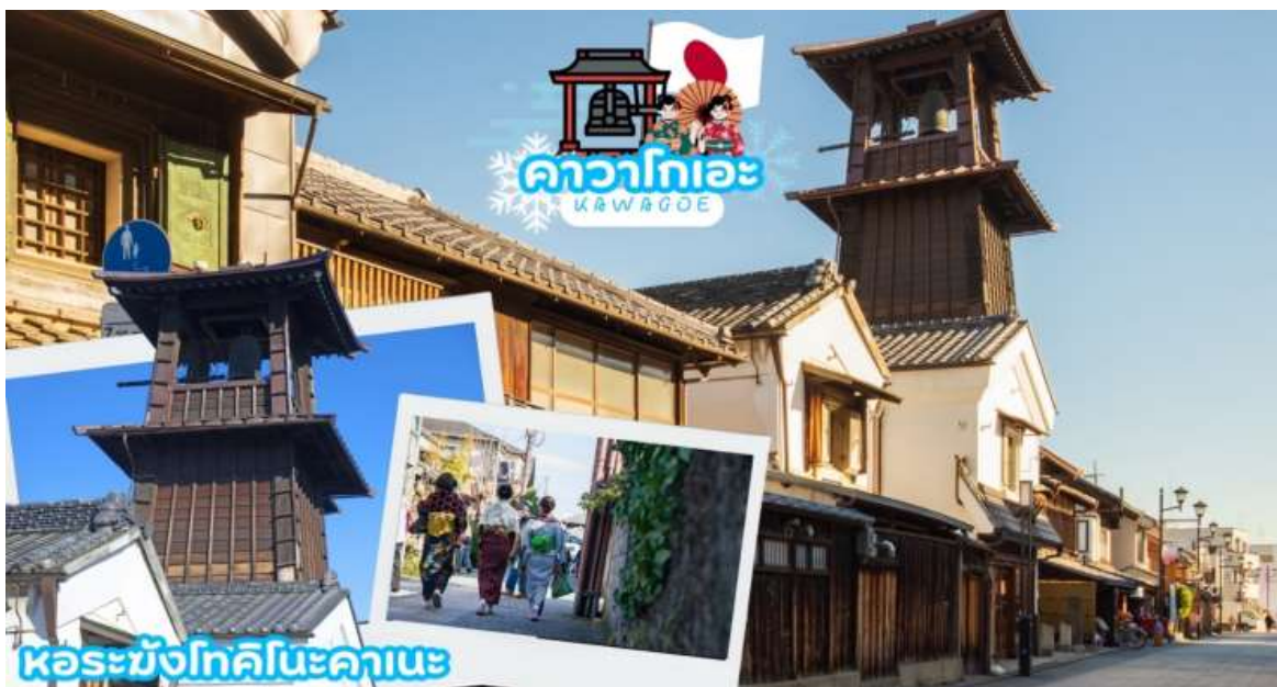
GO2HND-TG18- TOKYO ILLUMINATION NEW YEAR 6D 4N BY TG

เดินทางสู่ คาวาโกเอะ (Kawagoe) ได้รับการขนานนามว่าเป็นลิตเติลเอโดะ เพราะมีบรรยากาศที่มีความเป็นเมืองเก่าที่ได้กลิ่นอายโบราณทำให้รู้สึกเหมือนได้ย้อนยุค ได้สัมผัสบรรยากาศของโกดังเก่า ที่เรียงรายกันยาวตลอดระยะทางกว่า 700 เมตร ในสมัยก่อนเป็นสถานที่เก็บกักเสบียงอาหารเพื่อส่งไปให้เมืองเอโดะ (โตเกียวในปัจจุบัน) แต่ในปัจจุบันได้ถูกเปลี่ยนเป็นร้านค้า ร้านอาหาร ร้านขายของที่ระลึก ไม่ว่าจะเป็นร้านขนมที่ทำจากมันหวานสีเหลืองและสีม่วงอันเป็นผลิตภัณฑ์ขึ้นชื่อของเมืองนี้ สถานที่ท่องเที่ยวอันมีชื่อเสียงของเมืองคาวาโกเอะ