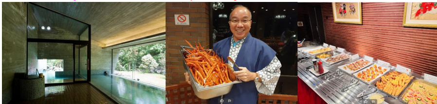
JIRAGONNO FUJI HOTEL ONSEN OR SIMILAR CLASS

คำ รับประทานอาหารค่ำ ณ ภัตตาคารโรงแรม บริการท่านด้วยอาหารแบบบุฟเฟ่ต์หลากหลายทั้งอาหารญี่ปุ่น อาหารยุโรปและอาหารจีน รวมทั้งซูชิหรือข้าวปั้นหน้าปลาดิบ พร้อมด้วยมุมสลัดบาร์ ของหวาน และผลไม้ตามฤดูกาล พิเศษ! อิ่มอร่อยกับบุฟเฟ่ต์ชาบูยักษ์ที่ท่านได้ทานกันอย่างไม่อั้น !