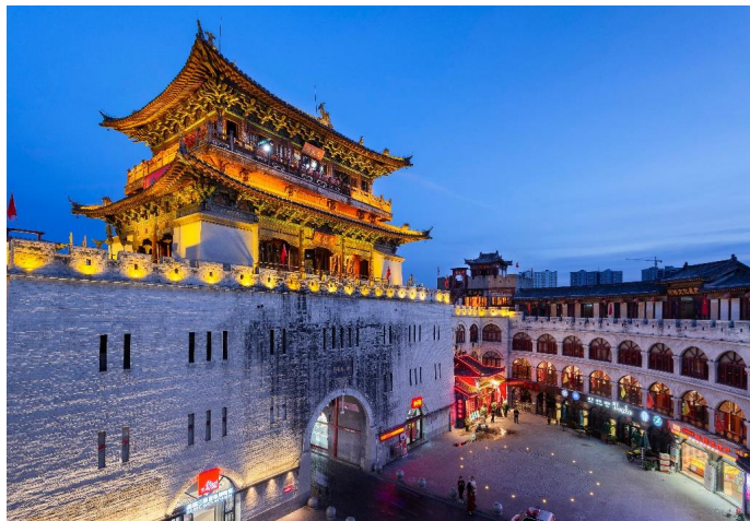
**อิสระรับประทานอาหารค่ำ ณ ถนนคนเดินลี่จินเหมิน**

ที่พัก Rezen Hotel หรือเทียบเท่า 4 ดาวจีน