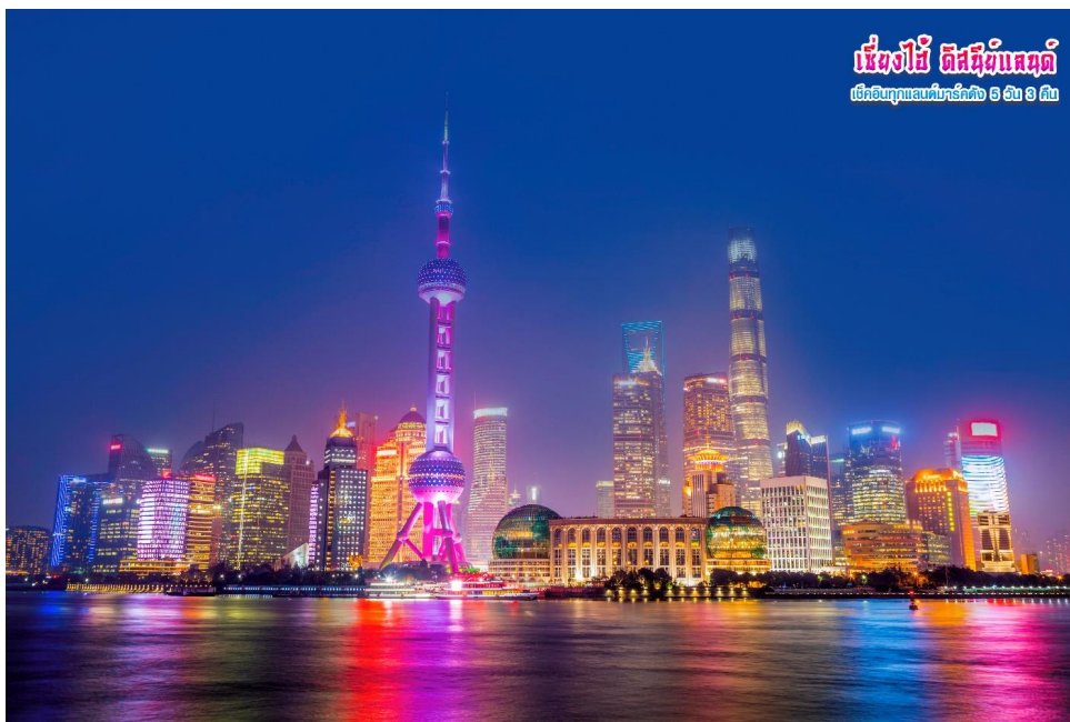
เซี่ยงไฮ้ ดิสคัฟเวอรี เที่ยวชมทุกแลนด์มาร์คถึง 5 ชั้น 8 คน

** ชำระค่าทัวร์ในนามบริษัท ไลออน ทราเวล จำกัด เท่านั้น **