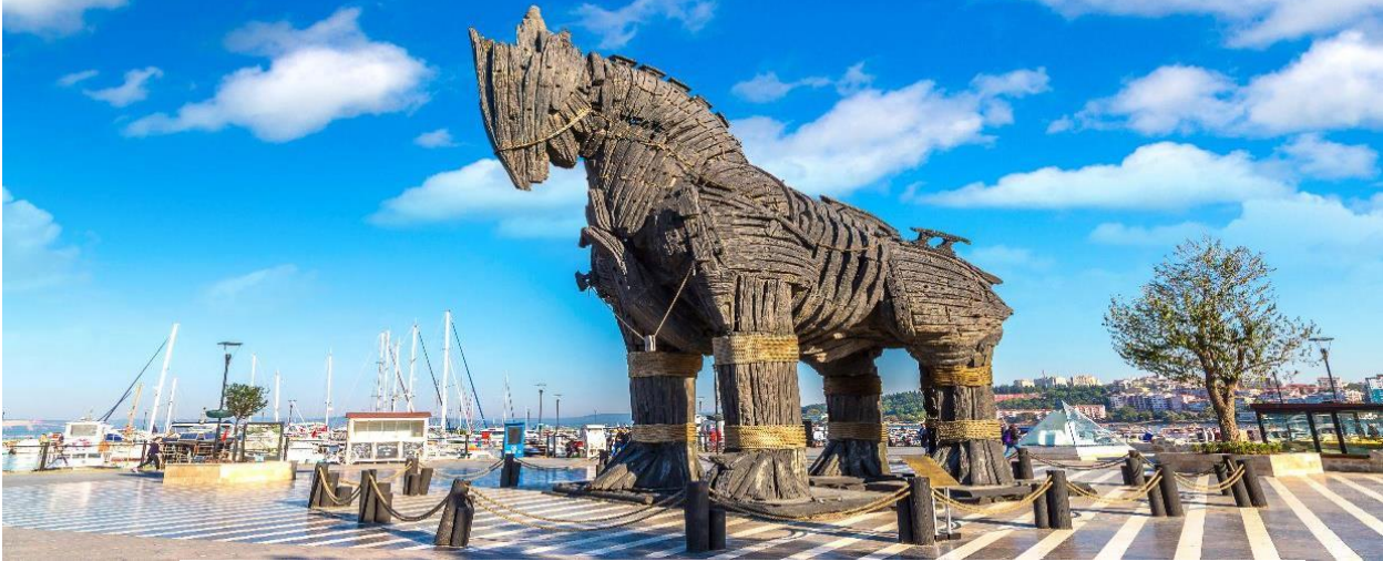
Highlight! บ้านไม้ เป็นที่โด่งดังมาจากภาพยนตร์ฮอลลีวูดเรื่องทรอย(Troy) หลังจากนั้นทางทีมงานจึงมอบบ้านไม้จำลองตัวนี้ให้กับ ทางการตุรเคียเพื่อเป็นเกียรติและสร้างชื่อเสียงให้กับเมืองชานัคคาเล 🇹🇷

เช้า 🍷 รับประทานอาหารเช้า ณ โรงแรม เนื้อที่ 2 นำทุกท่าน เช็คอินแลนด์มาร์คสำคัญ บ้านไม้เมืองทรอย (Troy) หรือ บ้านโทรจัน (Trojan Horse) เป็นบ้านขนาดใหญ่ที่ทำมาจากไม้ เปรียบเสมือนสัญลักษณ์อันชาญฉลาดด้านศึกของนักรบโบราณ โดยเป็นสาเหตุทำให้กรุงทรอยแตก นำท่านเดินทางสู่ เมืองปามุกคาเล่ (Pamukkale) เมืองแห่งสปา เนื่องจากเป็นพื้นที่ที่มีบ่อน้ำพุร้อนธรรมชาติที่มีชื่อเสียงมาก