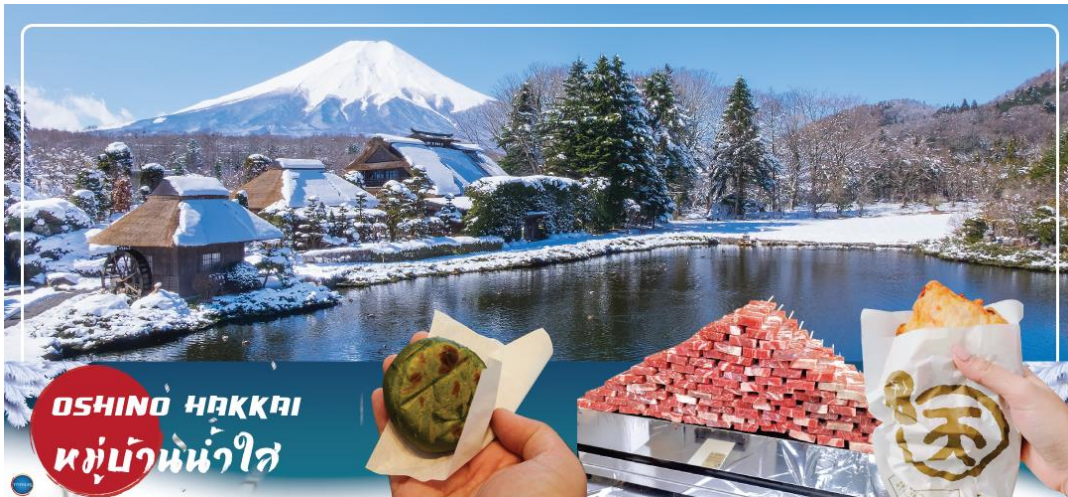
OSHINO HAKKAI หมู่บ้านน้ำใส

เล็กๆ ประกอบด้วยบ่อน้ำ 8 บ่อในโอชิโนะ ตั้งอยู่ระหว่างทะเลสาบคาวากูจิโกะ กับทะเลสาบยามานาคาโกะ บ่อน้ำทั้ง 8 นี้เป็นน้ำจากหิมะที่ละลายในช่วงฤดูร้อน ที่ไหลมาจากทางลาดใกล้ภูเขาไฟฟูจิ ผ่านหินลาวาที่มีรูพรุนอายุกว่า 80 ปี ทำให้น้ำใสสะอาดเป็นพิเศษ นอกจากนี้ยังมีร้านอาหาร ร้านจำหน่ายของที่ระลึก และขนมอร่อยๆ ที่ขายทั้งผัก ขนมหวาน ผักดอง งานฝีมือ และผลิตภัณฑ์ท้องถิ่นอื่นๆ อิสระให้ท่านได้เพลิดเพลินกับการถ่ายรูปและซื้อของที่ระลึกตามอัธยาศัย