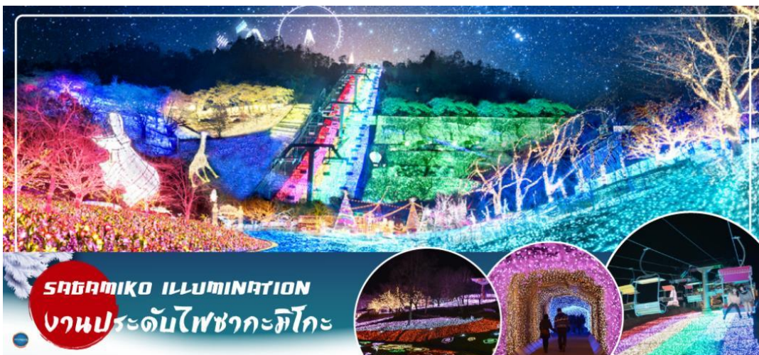
SAGAMIKO ILLUMINATION งานประดับไฟซากะมิโกะ

จากนั้นเดินทางสู่จังหวัด คานากาวะ (Kanagawa) (ใช้เวลาเดินทางประมาณ 1 ชั่วโมง) ตั้งอยู่ติดกับโตเกียวในภูมิภาคคันโต มีโยโกฮาม่า เป็นเมืองหลัก มีเมืองน่าเที่ยวอย่างคามาคูระ, โยโกสูกะและฮาโกเน่ คานางาวะรวมไว้ทั้งความเจริญทางวัตถุ ความอุดมสมบูรณ์ของธรรมชาติ ความเชื่อ และวัฒนธรรมเข้าด้วยกัน คานากาวะจึงเป็นจังหวัดที่เหมาะสมแก่การเดินทางไปท่องเที่ยวเป็นที่สุด จากนั้นนำท่านชม งานประดับไฟซากะมิโกะ (Sagamiko Illumination) เป็นหนึ่งในการแสดงแสงสีฤดูหนาวที่ใหญ่ที่สุดในญี่ปุ่น โดยใช้ไฟ LED หลากสีสันประมาณ 6 ล้านดวงและนับเป็นหนึ่งในสามการแสดงแสงสีฤดูหนาวที่ยิ่งใหญ่ที่สุดของภูมิภาคคันโต โดยในแต่ละปีก็จะมีมีการแสดงแตกต่างกันออกไป โดยปีนี้ เป็นธีมริลัคคุมะ อิสระให้ท่านเดินชมงานประดับไฟ พร้อมถ่ายภาพเก็บความประทับใจตามอัธยาศัย