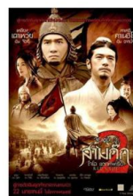
ภาพยนตร์และซีรีส์ชื่อดัง ถ่ายทำที่ Hengdian World Studios