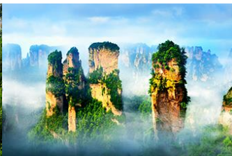
กุเขาวตาร