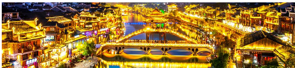
เมืองโบราณฟงหวง

จากนั้นนำท่านเดินทางสู่ เมืองโบราณฟงหวง (เมืองหงส์) 凤凰古城 ใช้เวลาเดินทางประมาณ 2 ชั่วโมง เมืองนี้ตั้งอยู่ในเขตปกครองตนเองของชนเผ่าตู่เจีย ตั้งอยู่ริมแม่น้ำฉิวเจียงทางทิศตะวันตกของมณฑลหูหนาน ล้อมรอบด้วยขุนเขาเสมือนค่านช่องแคบภูเขาฟงหวง ตั้งเด่นตระหง่านเสมือนป้อมปราการ ชาน้ำฉิวเจียงใสสะอาดราวน้ำบริสุทธิ์ที่ถูกกลั่นกรองจนมองเห็นก้นลำธาร ชุมชนที่เป็นบ้านเรือนจีนโบราณแบบยกพื้นสูงเรียงรายกันริมแม่น้ำ ช่างเป็นทัศนียภาพที่สวยงามมีเสน่ห์ของเมืองโบราณฟงหวง ราวกับดินแดนมนูญย์ที่สร้างอยู่บนสวรรค์.. *** นำท่านนั่งรถมัลล์ของเมืองโบราณฟงหวงเข้าสู่โรงแรมในเมืองเก่า * กระเป๋าสัมภาระรวมค่าพนักงานขนจากรถบัสไปโรงแรมแล้ว