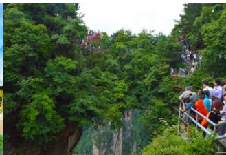
สะพานหนึ่งใบใต้ห้ำ

วันที่หก จางเจียเจียะ-ขึ้น-ลงลี้พท์แก้วเที่ยวเขาเทียนจื่อซาน-กุเขาวตาร-สะพานหนึ่งใบใต้ห้ำ -ออฟชั่นะจก สะพานกรจกข้ามเขาแกรนด์แคนยอน