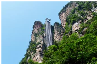
ลี้พท์แก้วไปหลง

หลังอาหารนำท่านเดินทางเข้าที่พัก หรือท่านสามารถเลือกซื้อโปรแกรมเสริม เป็นบัตรชมการแสดง ชุด The Love Story of a Wooden man and Fairy fox หรือที่เรียกกันในหมู่นักท่องเที่ยวไทยว่า โชว์จิ้งจอกขาว เป็นการแสดงกลางแจ้งที่ทุ่มทุนสร้างอย่างสุดอลังการ เป็นการแสดงที่น่าดูชมที่สุดในเมืองจางเจียเจียะ การแสดงชุดนี้ใช้ภูเขาประติมากรรมเป็นฉากหลังประกอบการแสดง ซึ่งให้ความรู้สึกสมจริงเสมือนผู้ชมและนักแสดงอยู่ท่ามกลางธรรมชาติ ใช้ทีมงานนักแสดงหลายร้อยคน และระบบแสง สี เสียงที่ทันสมัยประกอบการแสดง อัตราค่าบริการสำหรับโปรแกรมเสริมการแสดงชุด The love Story of Wooden man and Fairy Fox ท่านละ 400 หยวน (หรือ 2,000 บาทขึ้นอยู่กับอัตราแลกเปลี่ยน) ระยะเวลาที่ใช้ในการเที่ยวชมการแสดง ประมาณ 3 ชั่วโมง รวมเวลาเดินทางไป กลับค่าบริการรวม ค่าบัตรเข้าชม ค่ารถรับ ส่ง และค่าน้ำดื่มของไกด์ท้องถิ่น ที่พักที่ ZHENMIAN HOTEL โรงแรมระดับ 4 ดาวหรือเทียบเท่าจางเจียเจียะ