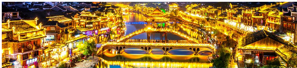
เมืองโบราณฟงหวง

จากนั้นนำคณะที่เข้าชมเมืองฟงหวง เมืองโบราณฟงหวง 凤凰古城 เมืองเก่าแก่อายุหลายร้อยปี ชมเมืองที่สร้างขึ้นสมัยราชวงศ์ถัง เดิมมีชื่อว่า “หวงซือเถียวกู่เจิง” กำแพงโบราณ และบ้านเรือนโบราณที่มีเอกลักษณ์เฉพาะของเมืองสร้างความโดดเด่นให้ที่นี่ บ้านเรือนโบราณในอดีตกาลบางส่วนถูกดัดแปลงเป็นร้านค้าและร้านจำหน่ายสินค้าที่ระลึกในปัจจุบัน ชมจัตุรัสหงส์ ที่มีรูปนกหงส์จำลองที่ทำจากทองเหลือง อันเป็นสัญลักษณ์ที่โดดเด่นของเมืองโบราณแห่งนี้...ชม สะพานหงเถียว 虹桥 สะพานไม้โบราณที่มีหลังคาคลุมเหมือนสะพานข้ามคลองในเวนิส สะพานแห่งนี้เคยเป็นด่านเก็บภาษีเกลือในสมัยราชวงศ์ชิง ซึ่งยังคงรักษารูปทรงในอดีตไม่เปลี่ยนแปลง..