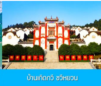
บ้านเกิดกวี ขวี่หยวน