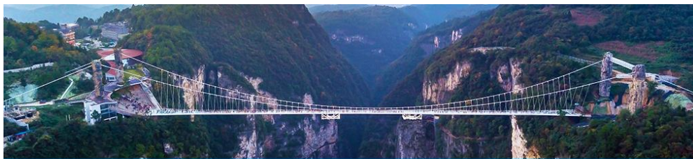
สะพานกระจกข้ามหุบเขาแกรนด์แคนยอน

หลังอาหารให้ท่านพักผ่อนตามอัชฌาศัย หรือ ท่านสามารถเลือกซื้อโปรแกรมเสริมซึ่งเป็นโปรแกรมท่องเที่ยวที่ไม่ได้รวมอยู่ในรายการท่องเที่ยว ได้แก่โปรแกรมเที่ยวสะพานกระจกที่ถูกสร้างครอบหุบเขาที่สูงที่สุดในโลก สะพานกระจกจางเจียเจีย (张家界大峡谷玻璃桥) ในเขตอุทยานแกรนด์แคนยอน ทำทาท่านด้วยการเดินผ่าน สะพานพื้นกระจกใสที่มีความสูงจากพื้น 980 ฟุต โดยมีความยาวของสะพาน 400 เมตร สะพานที่น่าหวาดเสียวแห่งนี้ออกแบบ โดย Haim Dotan วิศวกรชาวอิสราเอล โดยต้องการสร้างสะพานกระจกเพื่อเชื่อมต่อเขาสองยอดเข้าไว้ด้วยกัน สามารถรองรับนักท่องเที่ยวได้คราวละ 800 คนพร้อมกัน สะพานนี้เป็นอีกหนึ่งไฮไลท์สำหรับผู้มาเยือนจางเจียเจีย