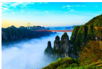
อุทยานป่าไผ่แห่งชาติไฉ้อ้าย