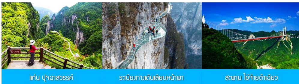
แท่น ปูจาสวรรค์

หลังอาหารเช้าเดินทางสู่ อุทยานป่าไม้แห่งชาติไ้อ้าย 矮寨国家森林公园 แหล่งท่องเที่ยวระดับ 5A ของจีนที่ตั้งอยู่ในมณฑลหูหนาน นำท่านชมความยิ่งใหญ่อลังการของทะเลภูเขาหินปูน ท่ามกลางธรรมชาติของผืนป่า นำท่านเดินสู่จุด แท่นหิน เว้นเทียนไถ 问天台 หรือ แท่น ปูจาสวรรค์ จุดชมวิวบนยอดเขาที่ถูกแวดล้อมด้วยภูเขาโดยรอบที่สูงกว่า ณ จุดนี้ท่านสามารถมองเห็นทัศนียภาพของขุนเขาโดยรอบแบบพาโนรามา เป็นจุดเช็กอินถ่ายภาพยอดนิยมสำหรับนักท่องเที่ยวที่มาเยือนอุทยาน.....นำท่านเดินผ่านระเบียงกระจกเลียบน้ำฟ้าที่มีความสูงจากพื้นล่างถึง 300 เมตร