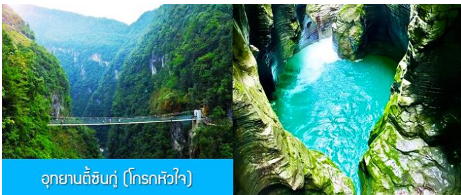
อุทยานตี้ซินกู (โกรกหัวใจ)

พักที่ โรงแรม ENSHI XIPU HOTEL ระดับ 4 ดาวท้องถิ่นหรือเทียบเท่าในเมืองเินซือ