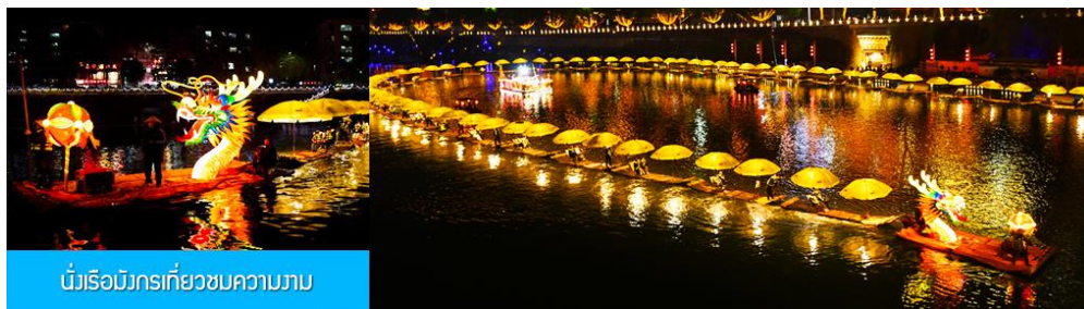
นั่งเรือมังกรเที่ยวชมความงาม

หลังอาหารนำท่านเดินทางเข้าที่พัก หรือท่านสามารถเลือกซื้อโปรแกรมเสริม เป็นตัวนั่งเรือมังกรเที่ยวชมความงามของบ้านเรือนและสิ่งปลูกสร้างสองฝั่งแม่น้ำในช่วงที่สวยงามที่สุดของเมือง เซียนเจิน ที่ประดับประดาด้วยแสงสี และได้ชื่อว่าเป็นวิวยามค่ำคืนที่สวยงามที่สุดในมณฑลหูเป่ย์ เช่นเดียวกับเมืองโบราณฟงหวงในมณฑลหูหนาน.....อัตราค่าบริการสำหรับ