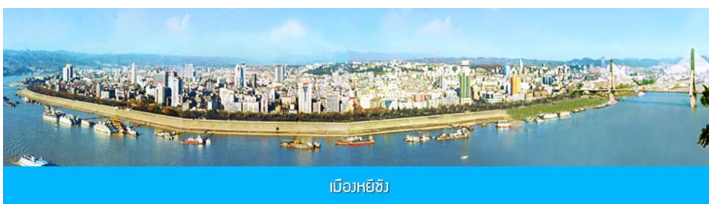
เมืองหยิว