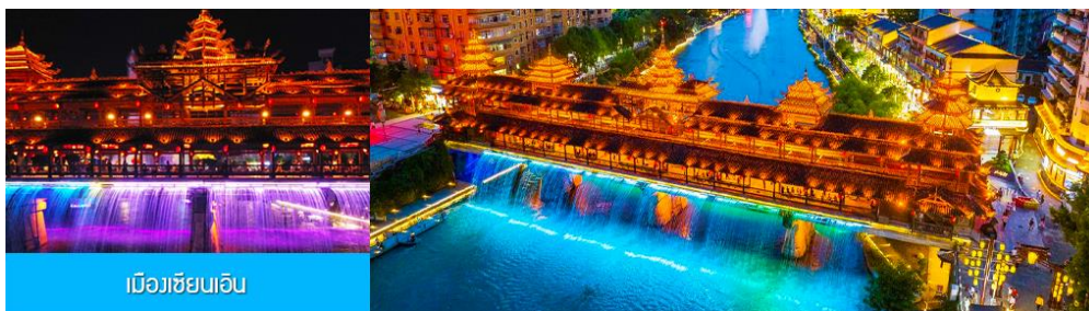
เมืองเซียนเจิน