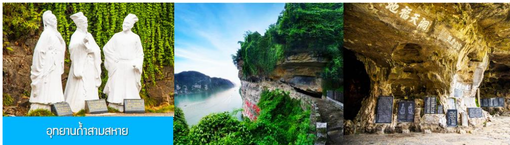
อุทยานถ้ำสามสหาย