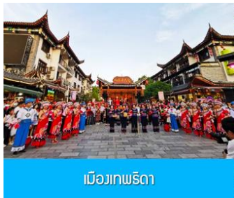
เมืองเทพริดา