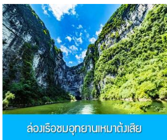
ล่องเรือชมอุทยานเหมาดังเสี่ย