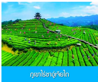
ภูเขาไร่ชาอู๋เจียโก

พักที่ โรงแรม ENSHI XIPU HOTEL ระดับ 4 ดาวท้องถิ่นหรือเทียบเท่าในเมืองเียนซือ