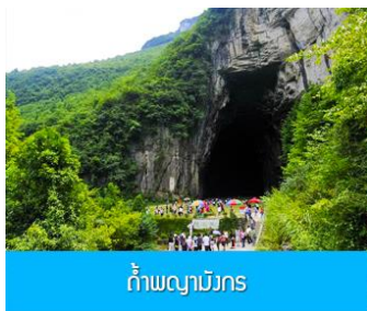
ถ้ำผญามังกร