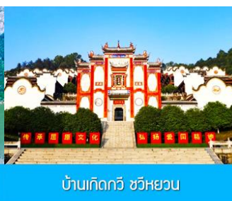
บ้านเกิดกวี ขิวหยวน

** ชำระค่าทัวร์ในนามบริษัท ไลออน ทราเวล จำกัด เท่านั้น **