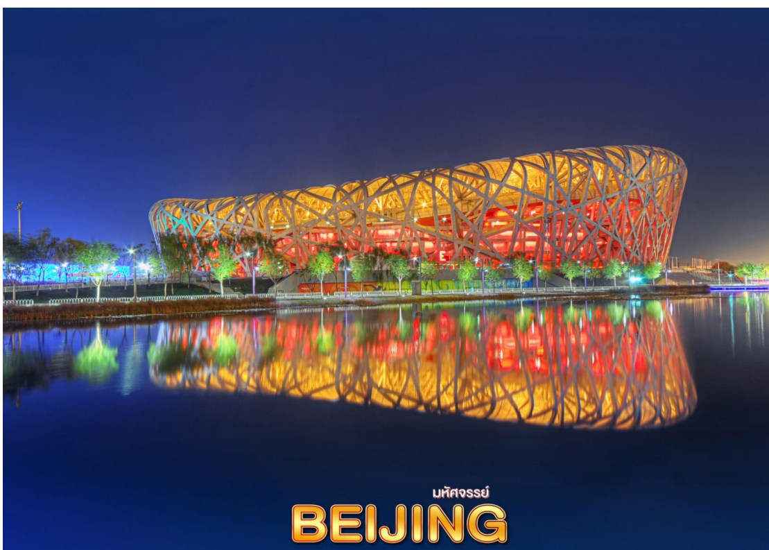
มหัศจรรย์ BEIJING

จากนั้น นำท่านแวะ ร้านยางพารา และผ่านชม สนามกีฬาฟางนง และ วอเตอร์คิวบ์ (Water Cube) ซึ่งเคยใช้เป็นศูนย์แข่งขันกีฬาโอลิมปิกในปี 2008 ต่อมามีการปรับปรุงพัฒนาให้เป็นสวนน้ำสุดทันสมัย ซึ่งปลดปล่อยจินตนาการสู่โลกมหัศจรรย์ใจกลางเมือง แนวคิดของ Water Cube สวนน้ำสุดล้ำแห่งนี้ได้รับแรงบันดาลใจมาจากฟองสบู่ที่ก่อตัวติดกันเป็นฟองเล็กฟองน้อยจนเกิดเป็นสฤคยอดนวัตกรรมขึ้นมา