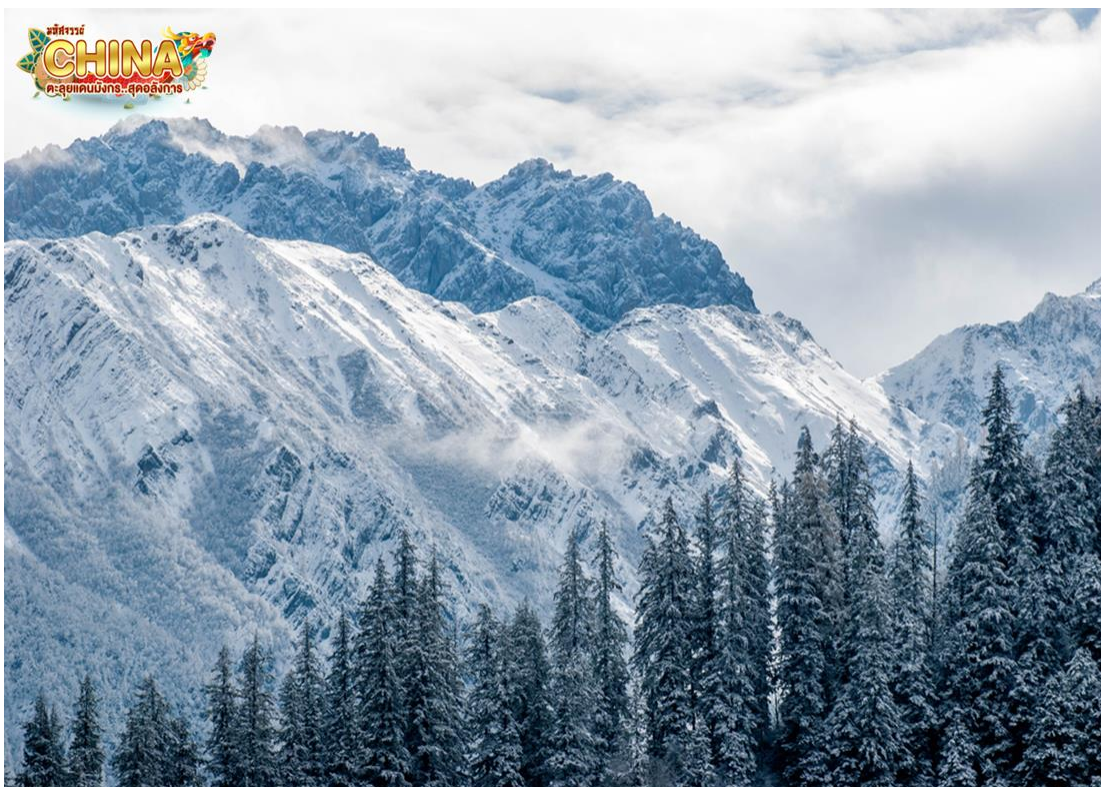
สถานที่ท่องเที่ยวที่อยู่ในอุทยานแห่งชาติจิวจ้ายโกว

จากนั้น นำท่านเดินทางสู่ อุทยานแห่งชาติจิวจ้ายโกว (โดยรถของอุทยาน) เพื่อชมมรดกโลกอุทยานแห่งชาติธารสวรรค์ “จิวจ้ายโกว” หนึ่งในมรดกโลกทางธรรมชาติของประเทศจีนที่ขึ้นชื่อเรื่องความสวยงามของภูเขา ลำธาร น้ำตก และทะเลสาบ ตั้งอยู่สูงกว่าระดับน้ำทะเลถึง 2,500 เมตร ภายในอาณาบริเวณอุทยานจิวจ้ายโกวประกอบด้วยภูเขาและหุบเขาอันสลับซับซ้อน เนื่องจากพื้นที่ส่วนใหญ่มีระดับพื้นดินที่ลดหลั่นจึงทำให้เกิดแอ่งน้ำน้อยใหญ่มากมาย ทั้งกลุ่มน้ำตกใหญ่น้อยและแม่น้ำ ซึ่งไหลมาจากหุบเขารวม 5 สาย ในยามฤดูใบไม้เปลี่ยนสีนั้น สีสนของทะเลสาบแห่งนี้จะเต็มไปด้วย สีแดง สีส้ม สีเหลือง ของใบไม้ที่ปลิดปลิวร่วงหล่นลงไปทะเลสาบ หากเป็นช่วงฤดูหนาวก็จะถูกปกคลุมไปด้วยหิมะให้บรรยากาศที่สวยงามไปในอีกรูปแบบหนึ่ง จนได้รับฉายาว่า “ดินแดนแห่งเทพนิยาย” (หมายเหตุ: ราคารวมรถอุทยานแล้ว (รถเวียน) หากต้องการเช่ารถแบบส่วนตัวทั้งกรุ๊ป ต้องชำระเพิ่มกับทางไกด์ท้องถิ่นหรือหัวหน้าทัวร์)