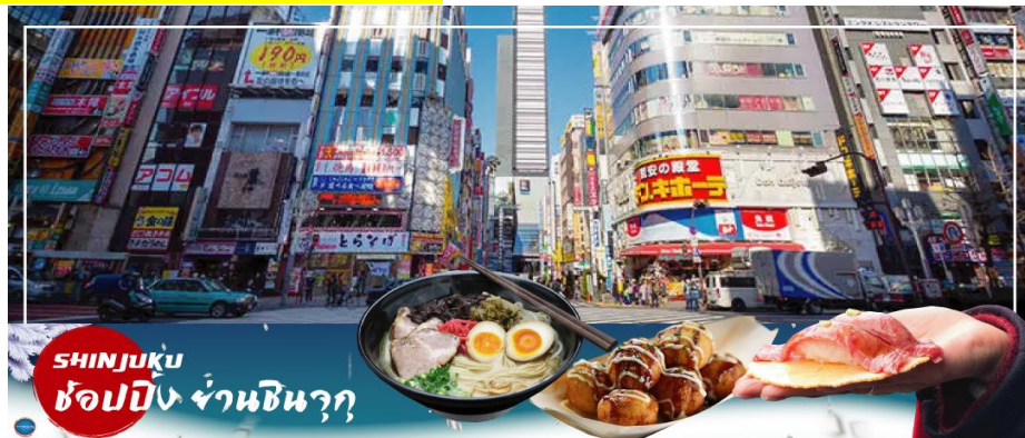
SHINJUKU ช้อปปิ้ง ย่านชินจูกุ