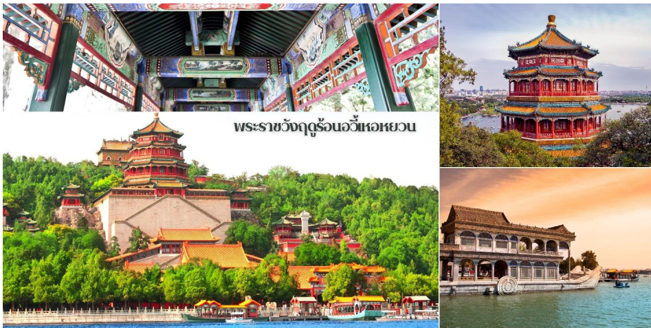
พระราชวังฤดูร้อนอวิ๋หนอหยวน