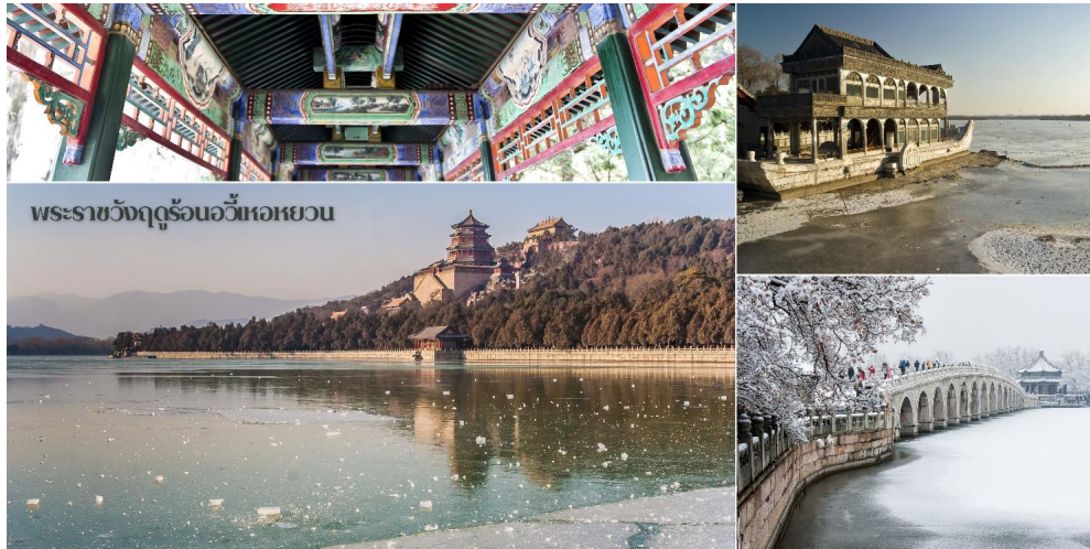
พระราชวังฤดูร้อนอวิ๋นเหอหยวน