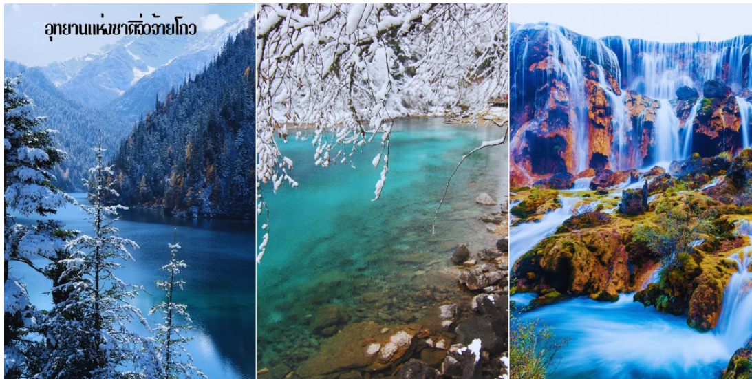
อุทยานแห่งชาติจ้าวโกว

นำท่านชม ทะเลสาบนกยูง (PEACOCK LAKE) มีความยาว 310 เมตร มีรูปร่างลักษณะคล้ายนกยูง มีน้ำสีฟ้าอมน้ำเงินในบริเวณน้ำลึก และสีเขียวมรกตในบริเวณน้ำตื้น และสองประกายเป็นสีทองยามสะท้อนกับแสงแดดพวย ตัวทะเลสาบนั้นตั้งอยู่ภายในหุบเขาที่เต็มไปด้วยด้วยต้นไม้หนานาชนิด ยิ่งในยามฤดูใบไม้เปลี่ยนสีนั้น สีต้นของทะเลสาบแห่งนี้จะเต็มไปด้วยสีแดง สีเหลืองของใบไม้ที่ร่วงหล่นในทะเลสาบ แต่หากเป็นช่วงพายุหนาวก็จะถูกปกคลุมไปด้วยหิมะให้บรรยากาศที่สวยงามไปในอีกรูปแบบหนึ่ง นำท่านชม ทะเลสาบแพนด้า (PANDA LAKE) มีความลึกโดยเฉลี่ย 14 เมตร สูงจากระดับน้ำทะเล 2,587 เมตร ทะเลสาบแพนด้าจึงเป็นหนึ่งในสองทะเลสาบของจ้าวโกวที่มีน้ำจับตัวเป็นน้ำแข็งในฤดูหนาว ระดับน้ำของทะเลสาบมีการเปลี่ยนแปลงเสมอ เนื่องจากได้นำมีทางไหลไปยังน้ำตกแพนด้า ที่อยู่ใกล้ ๆ กัน