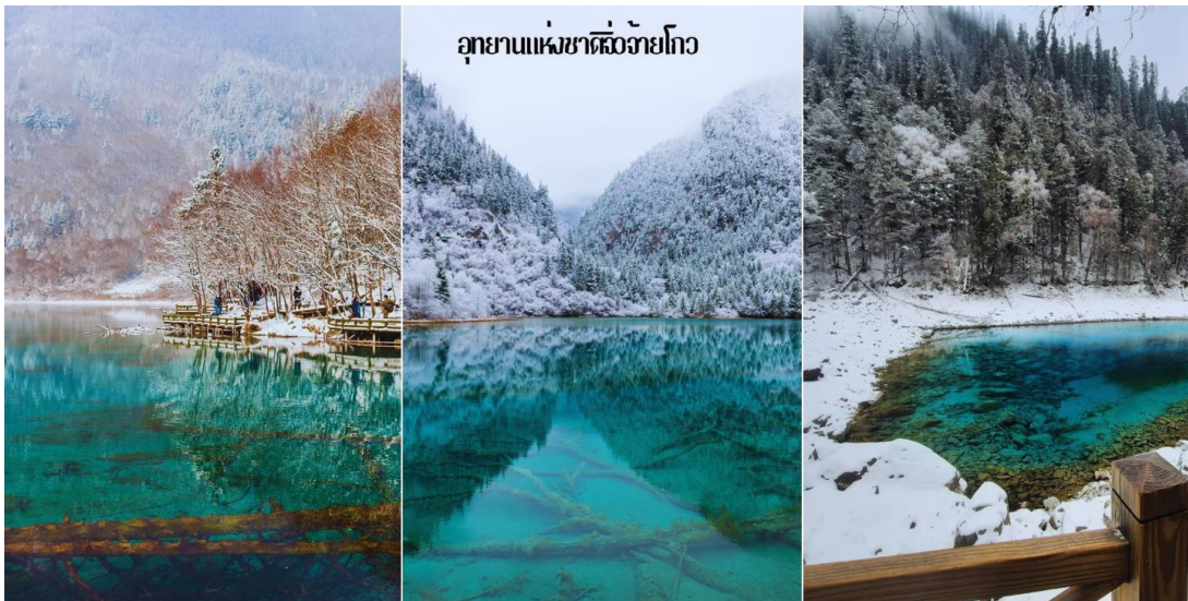
อุทยานแห่งชาติจิวจ้ายโกว

นำท่านเดินทางสู่ อุทยานแห่งชาติจิวจ้ายโกว (JIUZHAIYOU NATIONAL PARK) (อุทยานจิวจ้ายโกว) ตั้งอยู่ด้านทิศเหนือของมณฑลเสฉวน ซึ่งเป็นส่วนหนึ่งในบริเวณตอนใต้ของเทือกเขาหิมาลัย ห่างออกไปจากตัวเมืองเฉิงตูราว 500 กิโลเมตร จิวจ้ายโกวมีชื่อเสียงด้านความงามแห่งสีสันที่แปลกเปลี่ยนไม่รู้จบ ทะเลสาบผุดขึ้นท่ามกลางหมอกแมกไม้เขียวขจี น้ำใสเป็นประกายชุ่มฉ่ำ ยอดเขาหิมะตัดกับท้องฟ้าสีคราม เกิดเป็นภาพธรรมชาติอันงดงามที่แปรเปลี่ยนไปตามฤดูกาลผลิด้วยความสวยงามจึงทำให้อุทยานแห่งชาติจิวจ้ายโกว ได้ถูกขึ้นทะเบียนเป็นมรดกโลกทางธรรมชาติ ในปีค.ศ. 1992