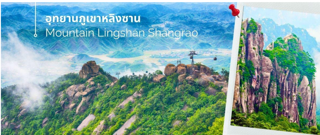
อุทยานภูเขาหลิงซาน Mountain Lingshan Shangrao

นำท่านเดินทางสู่ อุทยานภูเขาหลิงซาน ตั้งอยู่ทางตอนเหนือของประเทศจีน มณฑลช่างเหรา มีพื้นที่สวยงาม 160 ตารางกิโลเมตร หลิงซานถูกระบุว่าเป็น "หนึ่งใน 33 สถานที่ศักดิ์สิทธิ์ของโลก" โดยหนังสือลัทธิเต๋า เมื่ออากาศแจ่มใสและทัศนวิสัยดี คุณจะเห็นรูปลักษณะที่สวยงามและตั้งตรงของภูเขาหลิงซาน มีความเก่าแก่และมีมนต์ขลังมาก ไม่เพียงแต่มีภูมิทัศน์ที่สวยงาม แต่ยังมีตำนานที่ยาวนานอีกมากมาย เป็นส่วนหนึ่งของภูเขา Huaiyu ภูเขาหินสูงชันและคดเคี้ยวไปทางทิศตะวันตกจนกระทั่งถึงภูเขาไปหยุนเฟิง และแบ่งออกเป็นสองส่วน ส่วนหนึ่งไปทางเหนือและอีกส่วนหนึ่งไปทางทิศตะวันตก เหมือนพระจันทร์เสี้ยวที่ฝังอยู่ในดินแดนทางตะวันออกเฉียงเหนือของมณฑลเจียงซี จากนั้นพาท่านถ่ายภาพความสวยงามของหุบเขาหลิงซาน ในจุดชมวิวและถ่ายภาพที่ได้รับความนิยมจาก