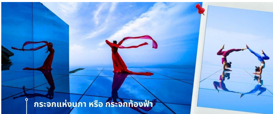
กระจกแห่งนภา หรือ กระจกห้องฟ้า

นักท่องเที่ยวจำนวนมาก นั่นคือ กระจกแห่งนภา หรือ กระจกห้องฟ้า เป็นจุดที่ท่านจะได้ เก็บภาพประทับใจของหุบเขาหลิงซานในมุมที่แปลกตา และน่าตื่นตะลึง ด้วยมีลักษณะที่เป็นกระจกเงาสะท้อนตัดกับเส้นขอบฟ้า และภูเขา ถึงทำให้เกิดภาพที่น่านมหัศจรรย์