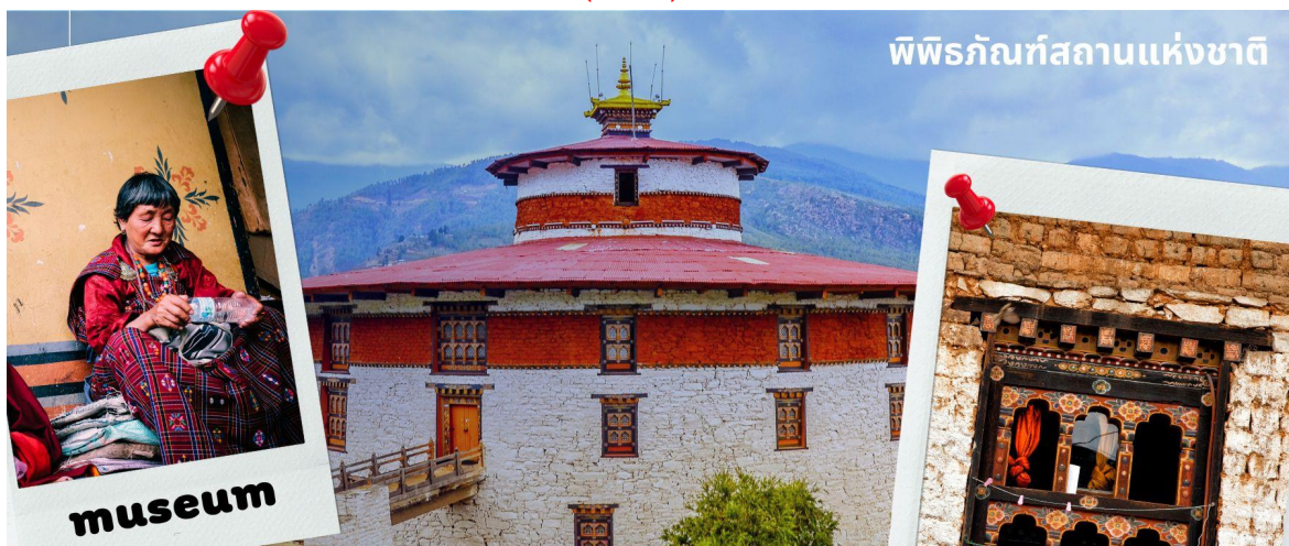
พิพิธภัณฑ์สถานแห่งชาติ

รับประทานอาหารเที่ยง ณ ภัตตาคาร (มื้อที่ 1)