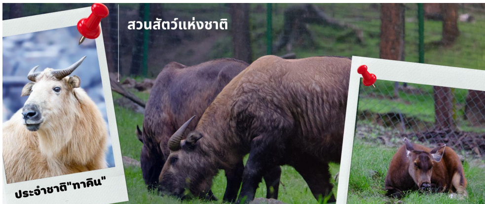
สวนสัตว์แห่งชาติ

นำท่านชม สวนสัตว์แห่งชาติของประเทศภูฏาน และชมสัตว์ประจำชาติ ทาคิน ที่มีรูปร่างลักษณะพิเศษผสมระหว่างแพะกับวัว มีแห่งเดียวในประเทศภูฏานเท่านั้น ซึ่งครั้งหนึ่งประเทศสหรัฐอเมริกาเคยเจรจาของไปเลี้ยงแต่ได้รับการปฏิเสธจากรัฐบาลประเทศภูฏาน ทาคิน เป็นสัตว์ในตำนานประวัติศาสตร์ของศาสนาพุทธ โดยเชื่อว่าท่านลามะ Drukpa Kunley เป็นผู้สร้างขึ้นจากกระดูกของแพะและวัวที่ท่านได้ท่านเป็นอาหาร กองกระดูกก็กลับมามีชีวิตอีกครั้งกลายเป็น ตัวทาคิน ที่มีลักษณะคล้ายกับแพะและวัวผสมกัน