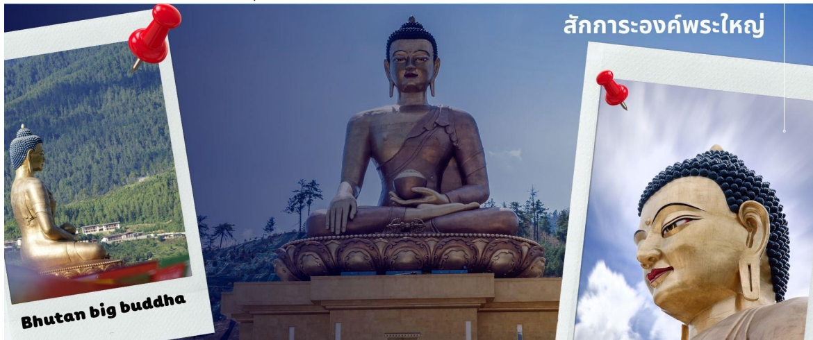
Bhutan big buddha

นำท่าน สักการะองค์พระใหญ่ ที่ตั้งอยู่สูงที่สุดในโลก และได้รับความร่วมมือจากเศรษฐีชาวสิงคโปร์ บริจาคเงินซื้อที่ดินและสร้างพระพุทธรูป ให้แก่รัฐบาลประเทศภูฏานให้ท่านไหว้ขอพรเพื่อเป็นศิริมงคล