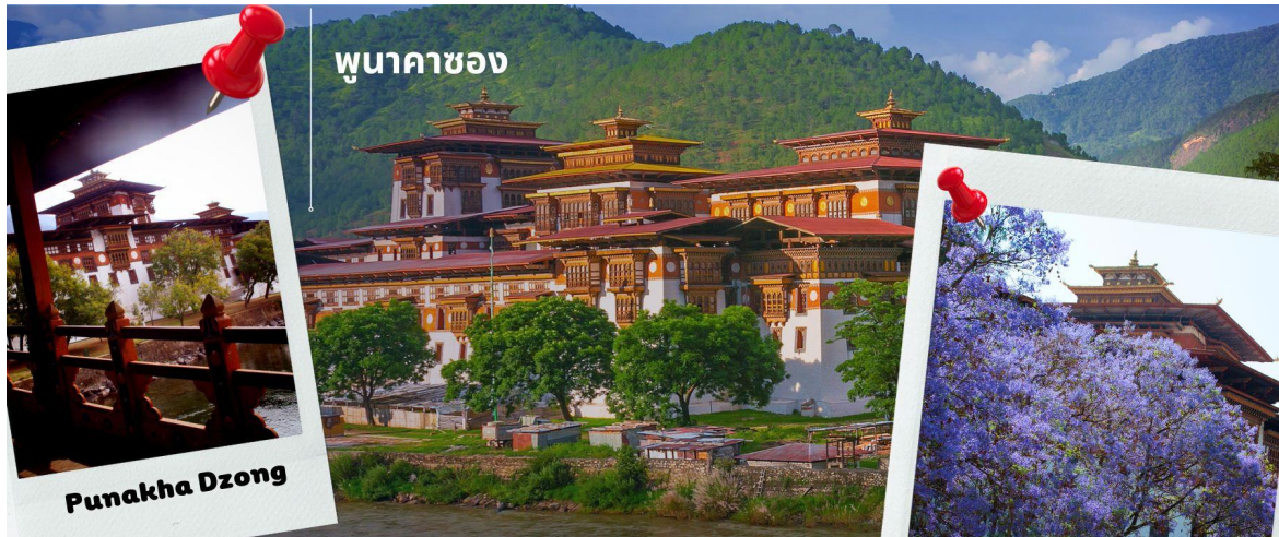
ภูนาคาซอง

CB3PBH1 ภูฏาน 5 วัน 4 คืน ภูฏาน แอร์ไลน์ B3 (Nov-Apr 25)