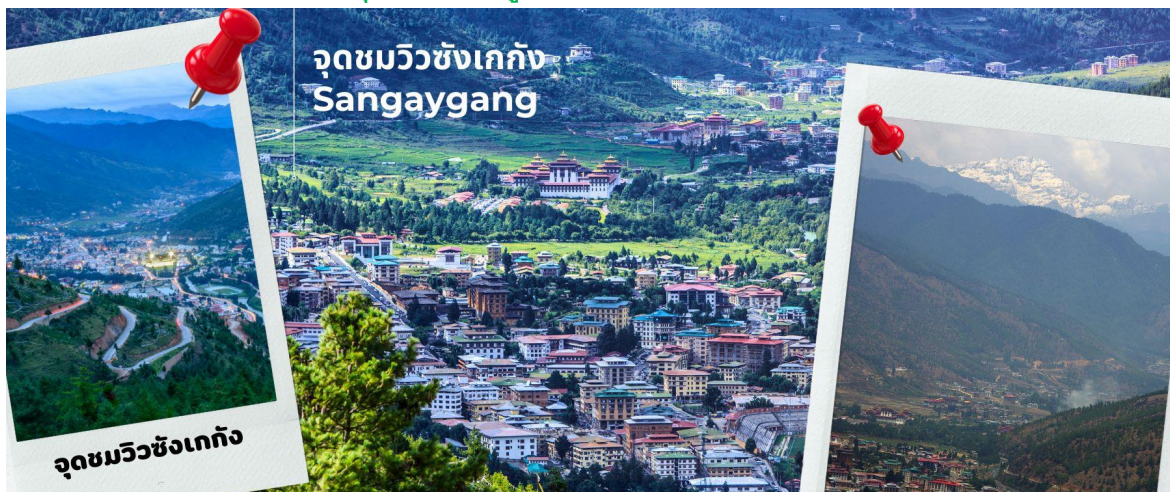
จุดชมวิวซังเกกัง Sangaygang

นำท่านชม จุดชมวิวซังเกกัง (Sangaygang) จุดชมวิวที่ทิวทัศน์ที่สวยงามของหุบเขาเมืองทิมพู เพื่อเก็บภาพประทับใจ จากนั้นนำทุกท่านเดินทางสู่เมืองพาโร ใช้เวลาประมาณ 1 ชั่วโมง