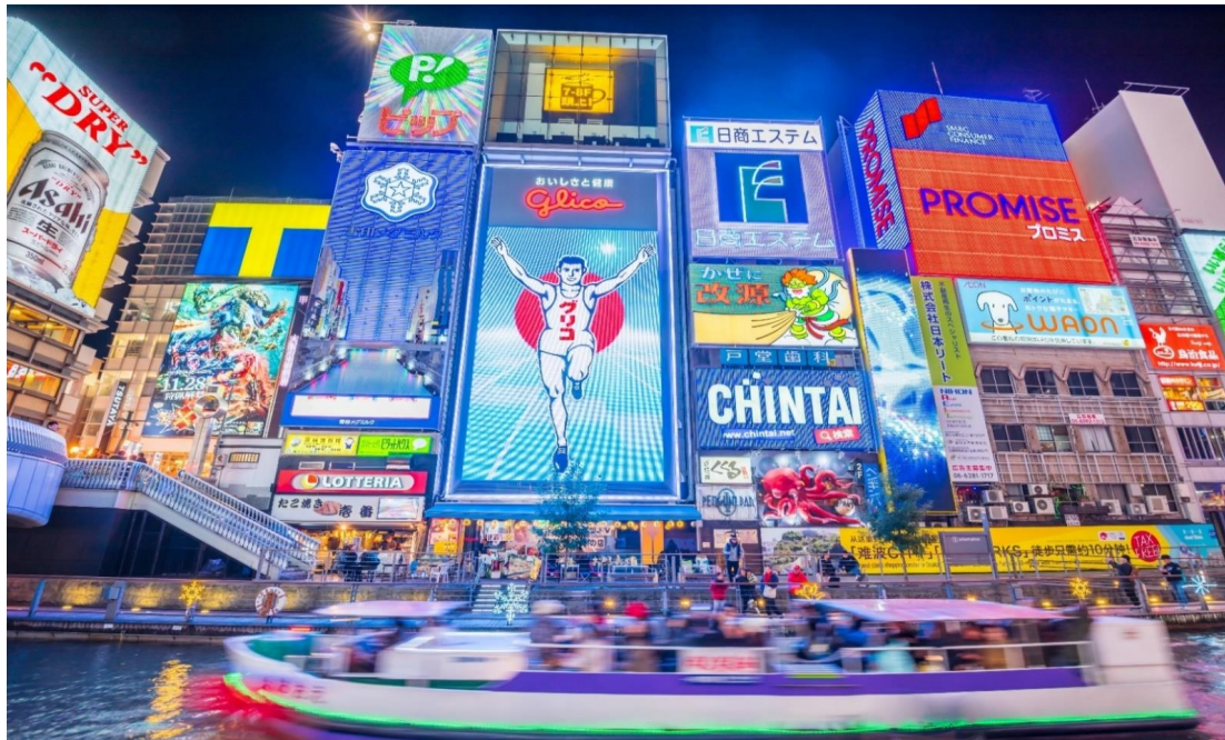
คำ อิสระอาหารตามอัธยาศัยเพื่อสะดวกแก่การช้อปปิ้ง ที่พัก SUN WHITE HOTEL, OSAKA หรือเทียบเท่า

** ชำระค่าทัวร์ในนามบริษัท ไลออน ทราเวล จำกัด เท่านั้น **