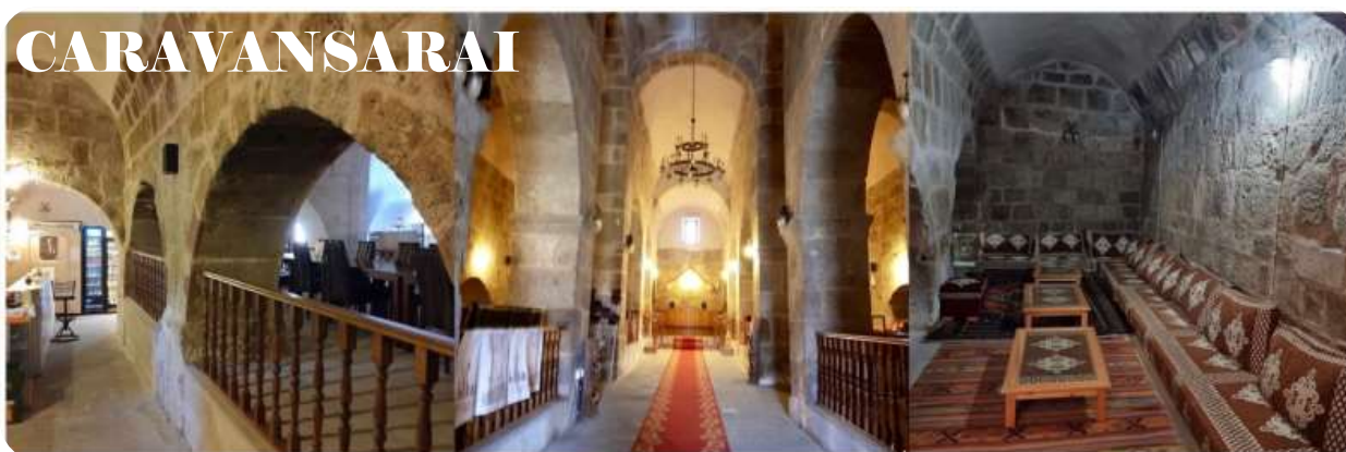
หน้า 8 (ภาพใช้เพื่อการโฆษณาเท่านั้น)

ระหว่างทางแวะถ่ายรูป CARAVANSARAI ที่พักรวมระหว่างทางของกองคาราวาที่เดินทางเส้นทางสายไหมของชาวเติร์กในสมัยออตโตมัน มีกำแพงล้อมรอบเพื่อป้องกันลมและฝน รวมทั้งพายุรุนแรงและการปล้นสดมภ์