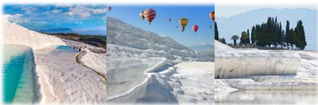
หน้า 9 (ภาพใช้เพื่อการโฆษณาเท่านั้น)

นำท่านชมปามุคคาเล่ (Pamukkale) เป็นภาษาตุรกี แปลว่า ปราสาทปุยฝ้าย (Cotton Castle) ปามุกแปลว่าฝ้าย คาเลีย่แปลว่าปราสาท เป็นน้ำตกสีขาวโพลน ลดหล่นกันลงมาเป็นชั้นส่งประกายสะท้อนกับแสงแดดระยิบระยับ บนหน้าผา โตรกเขา สีขาวบริสุทธิ์ของแร่แคลเซียมที่เกาะตัวอยู่บนเนินเขา ลดหล่นลงมาตั้งป้อมปราการเกิดจากน้ำพุร้อนที่สีแร่แคลเซียมคาร์บอเนตผสมอยู่เป็นจำนวนมากในธรรมชาติ เมื่อน้ำแร่