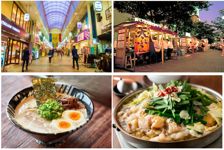
ซากาตะราเมง (Hakata Ramen) Image Only มตสึนาเบะ (Motsunabe)

อิสระรับประทานอาหารค่าตามอัธยาศัย เพื่อให้ท่านได้ช้อปปิ้งอย่างเต็มที่ (มีไกด์แนะนำ)