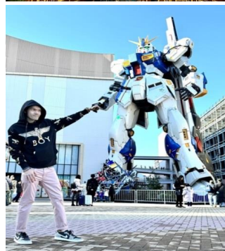
หุ่นกันดั้ม ชื่อ RX93 FF Nu Gundam