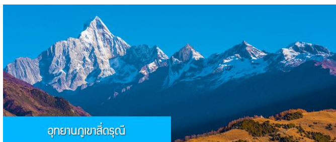
อุทยานภูเขาสี่ครุณี

หลังอาหารนำท่านเที่ยวชม หุบเขาขวงเฉียวโกว 双桥沟景区 ที่เป็นแหล่งท่องเที่ยวที่สวยงามที่สุดแห่งหนึ่งในเขตอุทยานภูเขาสี่ครุณี นำท่านนั่งรถบัสของอุทยานที่วิ่งไปผ่านเส้นทางที่สร้างคู่ขนานกับลำธารกษยในหุบเขา ท่านจะได้สัมผัสกับความสวยงามของทัศนียภาพธรรมชาติที่หาชมได้ยาก โดยมีภูเขาหิมะสูงตระหง่านอยู่เบื้องหลัง ธารน้ำใสไหลริน และสระน้ำที่มีสีเขียวมรกต ในฤดูใบไม้ผลิและฤดูร้อนท่านจะได้เห็นฝูงจามรีท่ามกลางทุ่งหญ้าเขียวจี ส่วนในฤดูหนาวทุ่งหญ้าและพื้นดินจะปกคลุมด้วยพรมหิมะสีขาว....รถบัสของอุทยานจะนำนักท่องเที่ยวไปยังจุดชมวิวสำคัญต่าง ๆ ภายในเขตอุทยาน เพื่อให้นักท่องเที่ยวได้เที่ยวชมสถานที่และถ่ายรูปตามอัธยาศัย จนครบแ่เวลา นำคณะขึ้นรถบัสออกจากอุทยาน