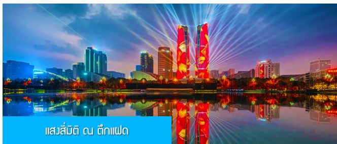
แสลลิ้มติ ณ ตึกแฝด