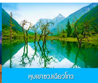
หุบเขาขวงเฉียวโกว