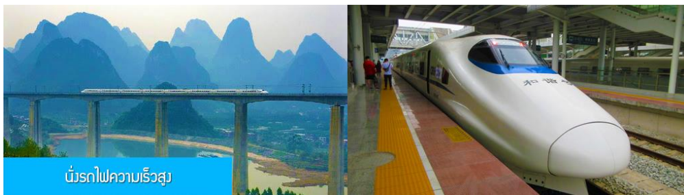
มังกรไฟความเร็วสูง

พักที่ GUILIN VIENNA HOTEL โรงแรมระดับ 4 ดาวท้องถิ่น หรือเทียบเท่าในเมืองกุ้ยหลิน