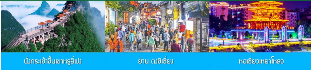
บันไดกระเช้าขึ้นเขาหลู่อ๋อง