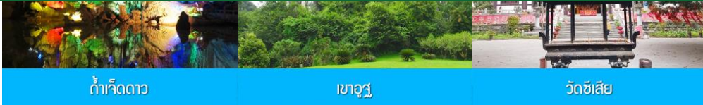
ถ้าเจ็ดดาว