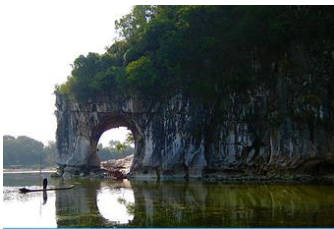
เขาวงว้าง

พักที่ GUILIN VIENNA HOTEL โรงแรมระดับ 4 ดาวท้องถิ่น หรือเทียบเท่าในเมืองกุ้ยหลิน