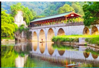
สวนเจ็ดดาว