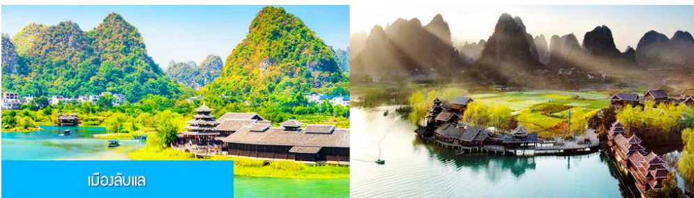
เมืองลับแล