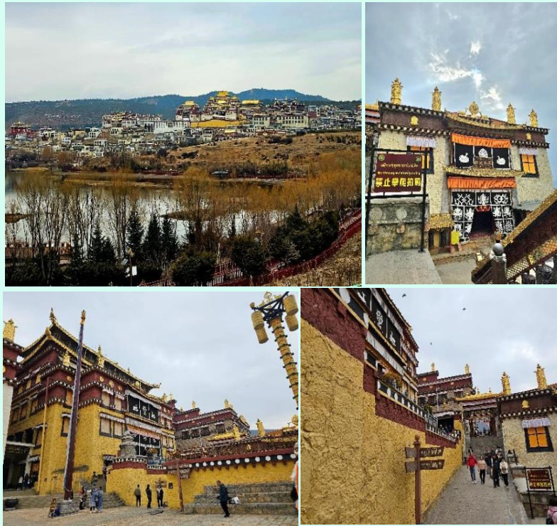
VLJG65DR-2 ตำบล ลี่เจียง แชงกรีล่า ภูเขาหิมะมังกรหยก 6วัน 5คืน By DR

หลังรับประทานอาหารเช้า นำท่านเดินทางสู่ วัดลามะชงจ้านหลิน วัดลามะแห่งนี้ ได้ถูกซึ่งสร้างขึ้นเมื่อปีที่ ค.ศ. 1679 ในสมัยราชวงศ์ชิง สร้างขึ้นโดยทะเลลามะองค์ที่ 5 ในปี พ.ศ. 2222 มีพระลามะจำพรรษาอยู่มากกว่า 700 รูป และได้มีการบูรณะตลอดมา วัดแห่งนี้ได้สร้างขึ้นตามลักษณะเดียวกับวัดโปตาลาของทิเบต วัดชงชานหลินเป็นวัดใหญ่ที่สำคัญของเมือง แชงกรีล่า นอกจากนี้ยังเป็นวัดนิกายลามะแบบทิเบตที่ใหญ่ที่สุดในมณฑลยูนนานซึ่งมี อายุที่เก่าแก่กว่า 300 ปี และในช่วงเทศกาล ชาวทิเบตส่วนใหญ่ ก็จะนิยมการเดินระบำหน้ากากและเป่าแตรรอนซึ่งเป็นการเล่นที่อยู่ในช่วง เทศกาล สำคัญต่างๆของวัด รวมถึงประเพณีต่างๆ ที่ชาวทิเบตได้อนุรักษ์ไว้