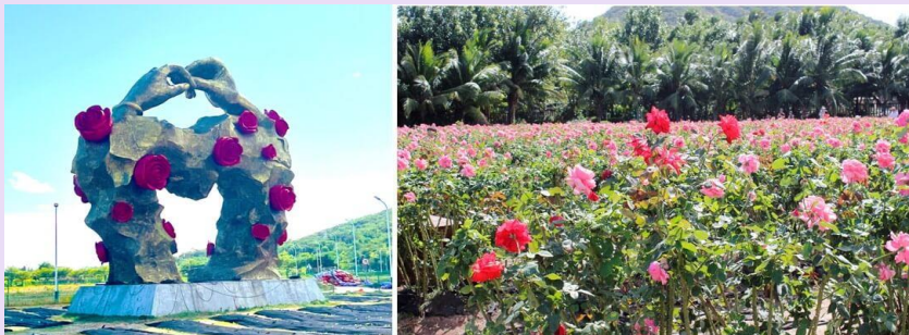
VSX52SL-3 ไลโล ไทหล่า เน้นถูกเที่ยวครบ คุ่มมมคุ้ม 5วัน2คืน By SL

นำท่านเยี่ยมชม ร้านผ้าไหม ให้ท่านได้เลือกซื้อผลิตภัณฑ์จากไหม ตามอริยาตัย (ใช้เวลาประมาณ 60 - 90 นาที) จากนั้นนำท่านชม ทุ่งดอกกุหลาบอ่าวย้าหลง (รวมรถกอล์ฟ) ให้ท่านได้ เพลิดเพลินกับการถ่ายรูปเพื่อเก็บความประทับใจ และเข้าชมสินค้าที่ผลิตด้วยดอกกุหลาบหลากหลาย เช่น ครีมทาหน้า น้ำหอมกลิ่นกุหลาบ ขนมดอกกุหลาบ เป็นต้น