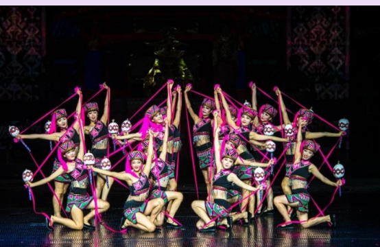
VSX52SL-3 ไลโล ไทหล่า เน้นถูกเที่ยวครบ คุ่มมคุ้ม 5วัน2คืน By SL