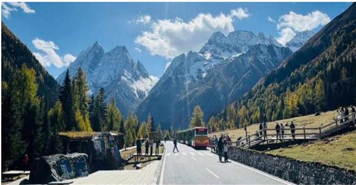
GO1TFU-TG108 เฉิงตู สี่ฤดู ฆวงเฉียวโกว ต่ากู่ปิงชว่น จี้จ้ายโกว 7วัน 6คืน (นั่งรถไฟความเร็วสูง) * ไม่ลงร้านซื้อป โดยสายการบิน Thai Airways (TG)

เช้า รับประทานอาหารเช้า ณ ห้องอาหารภายในโรงแรม (มื้อที่ 2)