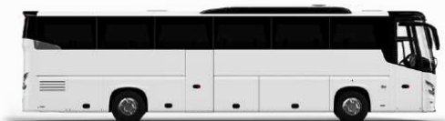
ตัวอย่างรถปรับอากาศ 1 ชั้น

ค่าที่พักตามที่ระบุในรายการหรือเทียบเท่าระดับเดียวกัน (พักห้องละ 2 ท่าน) หากประเภทห้องที่ท่านเลือกไม่พบ เช่น วิวทะเลหรือวิวเมืองเป็น TWIN BED หรือ DOUBLE BED ทางบริษัทขอสงวนสิทธิ์ในการปรับประเภทห้องพัก เป็นตามที่มีโรงแรมมีอยู่ โดยไม่ต้องแจ้งให้ทราบล่วงหน้า