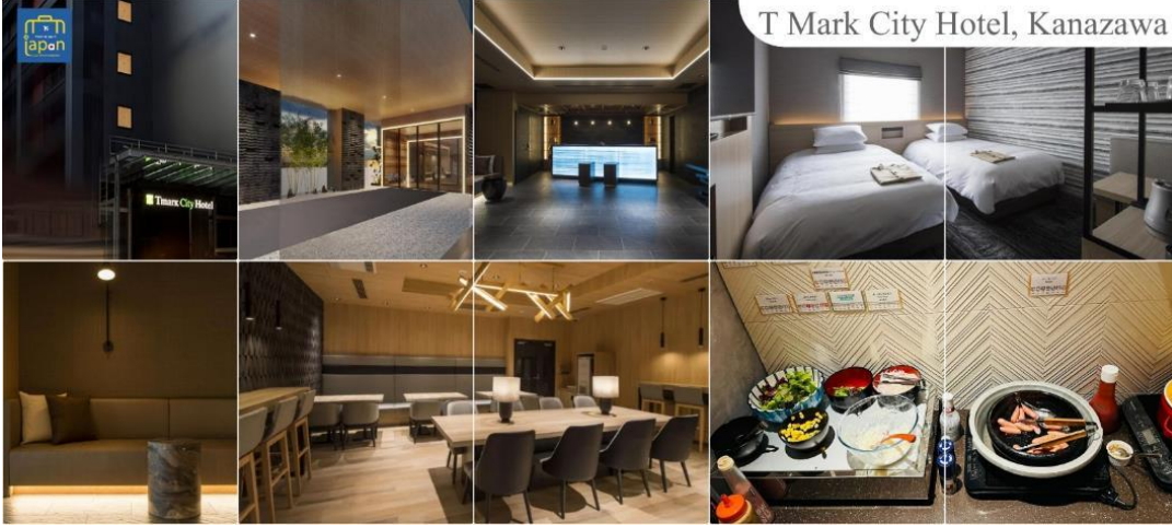
T Mark City Hotel, Kanazawa

พักที่ T MARK CITY HOTEL, KANAZAWA หรือเทียบเท่าระดับเดียวกัน