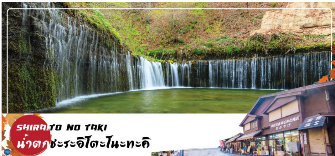
SHIRAITO NO TAKI น้ำตกชะระอิโตะโนะตะคิ

วันที่ห้า เมืองยามานาชิ - การเรียนพิธีชงชาญี่ปุ่น - จังหวัดชิซุโอกะ - น้ำตกชิราอิโตะ - นินงะไดระ ยูเมะ เทอร์เรซ - เมืองนาโกย่า - ย่านซาคาเอะ