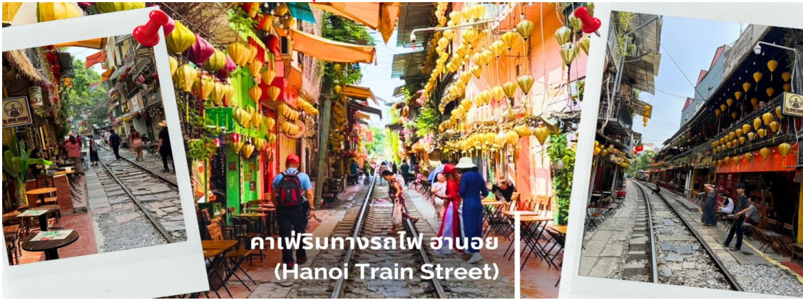
คาเฟ่ริมทางรถไฟ ฮานอย (Hanoi Train Street)