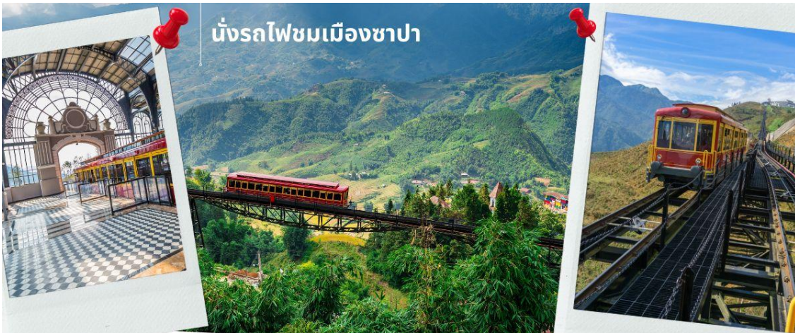
นั่งรถไฟชมเมืองซาปา

นำท่าน นั่งรถไฟชมเมืองซาปา (รวมค่ารถไฟชมเมือง) ท่านจะได้พบกับวิวทิวทัศน์ของเมืองซาปาที่เต็มไปด้วยความสดชื่น และสดกกลิ่นอายธรรมชาติ และยังตื่นตาไปด้วยวิวภูเขา และนาขั้นบันได ที่มีชื่อเสียงของเมืองซาปาอีกด้วย ความยาวประมาณ 2 กิโลเมตร โดยใช้เวลาประมาณ 20 นาทีเพื่อไปสู่สถานีขึ้นกระเช้า ที่จะนำท่านขึ้นสู่ยอดเขาฟานซีป็น