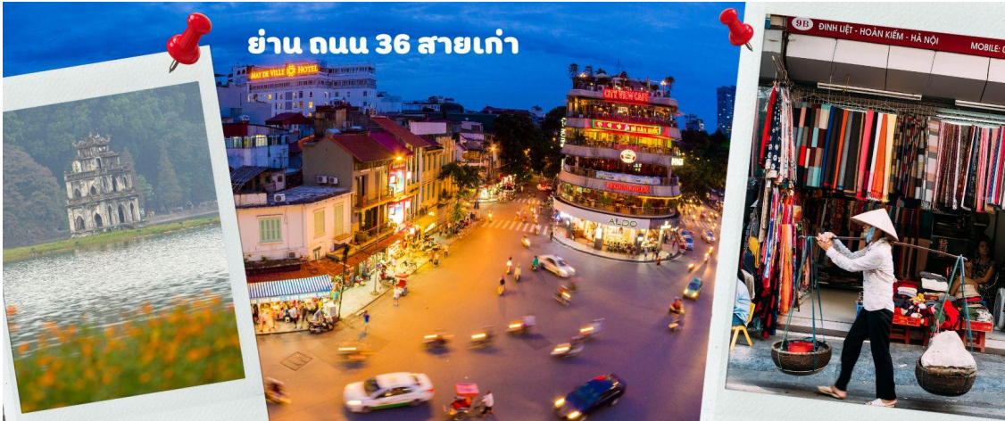
ย่าน ถนน 36 สายเก่า

ฮานอย จากนั้นให้ท่านได้ อิสระช้อปปิ้ง ถนนสาย 36 street แหล่งช้อปปิ้งของฮานอย มีต้นไม้ปกคลุมสองฝั่งถนน สาเหตุที่ชื่อถนน 36 มาจาก 36 อาชีพที่ทำการค้าขายบนถนนแห่งนี้ ตั้งแต่อดีตอย่างงานด้านหัตถกรรมสอดคล้องกับ ชื่อถนนแต่ละเส้น ในอดีตอย่าง เครื่องเงิน ผ้าไหม บนถนนแห่งนี้ แต่ปัจจุบันมากกว่า 36 ไปแล้ว ที่นี่จะเป็นแหล่ง Shopping มีสินค้าเกือบทุกชนิด ร้านขายชุดกีฬา มีทุกแบรนด์เพราะที่นี่เป็นแหล่งผลิตให้หลาย ๆ แบรนด์