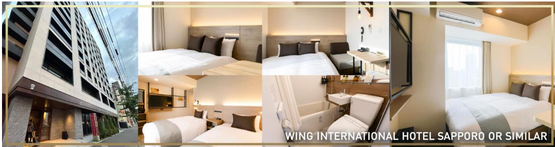
WING INTERNATIONAL HOTEL SAPPORO OR SIMILAR

พักที่ WING INTERNATIONAL HOTEL หรือ APA HOTEL, SAPPORO หรือเทียบเท่า