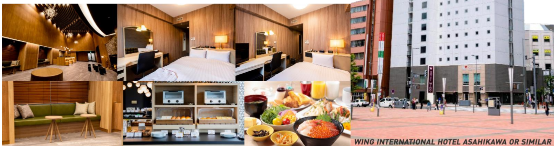
WING INTERNATIONAL HOTEL ASAHIKAWA OR SIMILAR

ที่พัก WING INTERNATIONAL HOTEL หรือ ART ASAHIKAWA, หรือเทียบเท่า