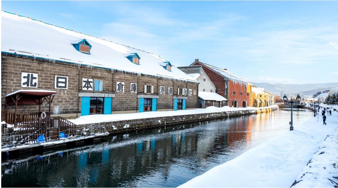
เที่ยง อีศระอาหาร เพื่อความสะดวกในการท่องเที่ยว

บรรยากาศสุดแสนโรแมนติก คลองแห่งนี้สร้างเมื่อปี 1923 โดยสร้างขึ้นจากการถมทะเล เพื่อใช้สำหรับเป็นเส้นทางขนถ่ายสินค้ามาเก็บไว้ที่โกดัง แต่ภายหลังได้เลิกใช้และมีการถมคลองครั้งหนึ่งเพื่อทำถนนหลวงสาย 17 แล้วเหลืออีกครึ่งหนึ่งไว้เป็นสถานที่ท่องเที่ยวมีการสร้างถนนเรียบคลองด้วยอิฐแดงเป็นทางเดินเท้ากว้างประมาณ 2 เมตร