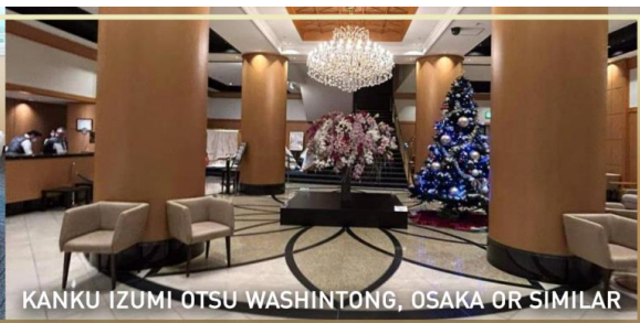
KANKU IZUMI OTSU WASHINTONG, OSAKA OR SIMILAR

วันที่ 5 สนามบินคันไซ – กรุงเทพ (ดอนเมือง)