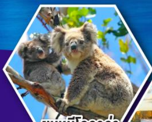
ชมหมีโคอาลา ณ สวนสัตว์ซิดนีย์