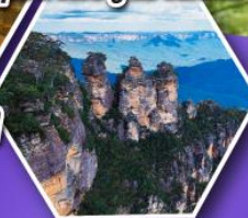
อุทยานบลูเมาส์เท่น