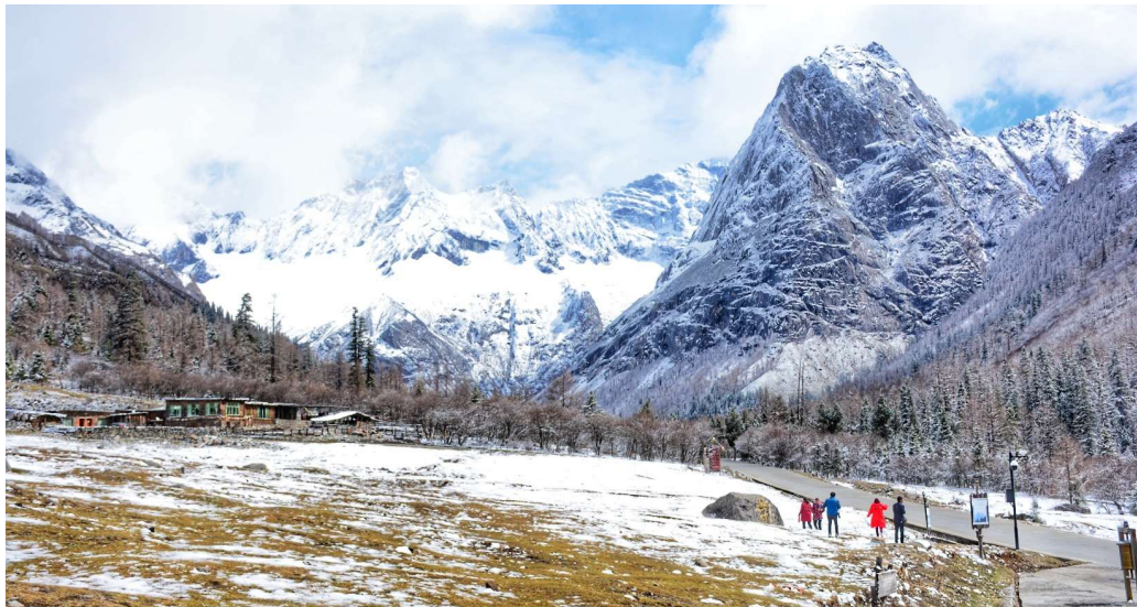
T2G-TFU09SL หนิ่ท่าว เจิงตุ 3 อุทยาน... สีดรุณี บี่เมิงโกว ต่ากุกลาเซียร์ 6D 5N (SL) ไม่งร้านรัฐบดล

นำท่านเดินทางเข้าสู่ อุทยานแห่งชาติฉางผิง ซึ่งเป็นที่ตั้งของ ภูเขาสิีดรุณี (ซื่อกุเหนียงชาน) ชาวทิเบตนิยมเรียกกันในนามเทพแห่งความศักดิ์สิทธิ์ "SKOLA" แปลว่า "เทพเจ้าผู้ปกป้องรักษา" ซึ่งชมความงดงามของภูเขาที่นักท่องเที่ยวชาวต่างชาติทั่วโลกพากันปักหมุดว่า "สักครั้งในชีวิตต้องมาเห็นด้วยตาตัวเอง" อีกทั้งธรรมชาติที่อุดมสมบูรณ์จึงเป็นจุดดึงดูดผู้คนให้มาสัมผัส