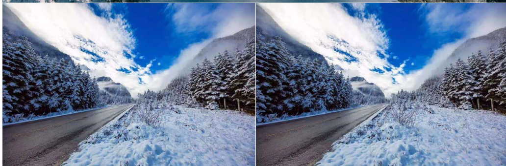
T2G-TFU09SL หนิ่ห่าว เจิงตุ 3 อุทยาน... สีดรุณี บี๋ผิงโกว ต่ากุกลาเซียร์6D 5N (SL) โม่ลงร่านรัฐบวล