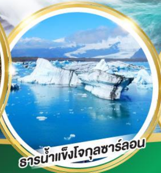
ธารน้ำแข็งโจกุลชาร์ลอน