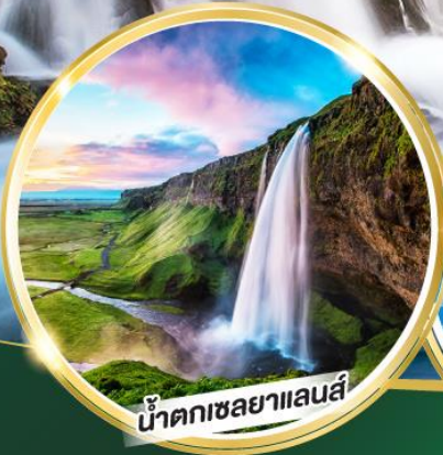
น้ำตกเซลยาแลนส์