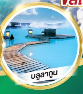
บรูลาทูน