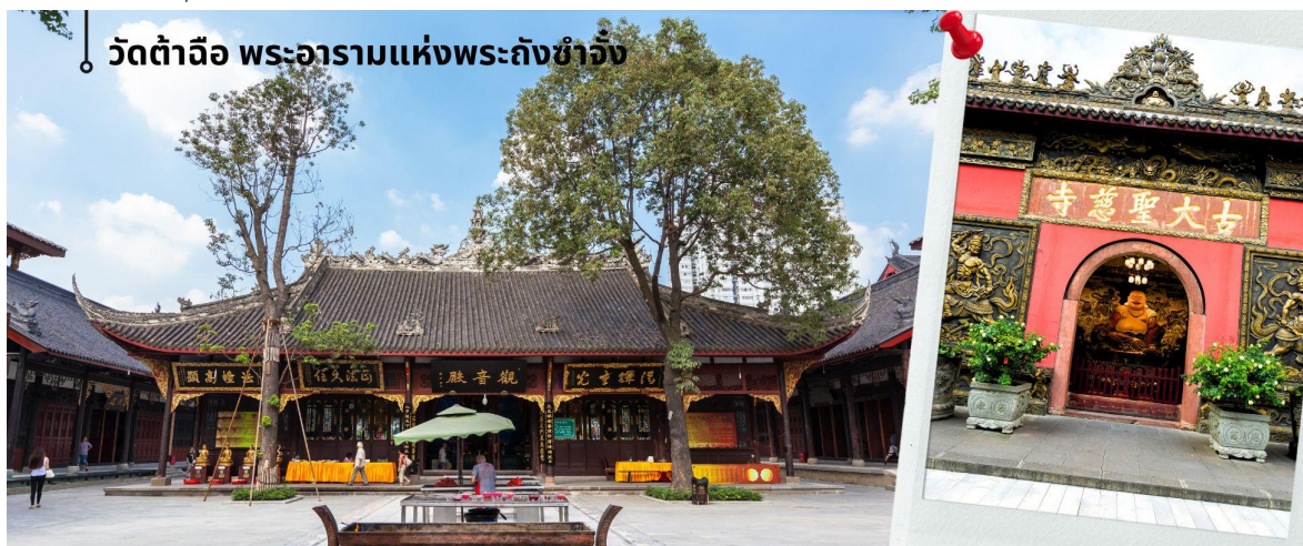
วัดต้าฉือ พระอารามแห่งพระถังซำจั๋ง

นำท่านชม วัดต้าฉือ พระอารามแห่งพระถังซำจั๋ง ใจกลางนครเฉิงตู พระถังซำจั๋ง ได้รับการสรรเสริญว่าเป็นผู้มีความเพียร และมีชื่อเสียงมายาวนานกว่า 1,400 ปี และยังได้รับการยกย่องว่าเป็น พระไตรปิฎกแห่งราชวงศ์ถัง พุทธประวัติของพระถังซำจั๋งถูกจารึกในสถานที่ต่าง ๆ มากมาย รวมไปถึงได้ถูกกล่าวถึงในจดหมายเหตุหลายเล่ม ตามเส้นทางการเดินทางแห่งความเพียรของท่าน รวมทั้งมีพระอัฐิของท่าน ประดิษฐานอยู่ในพระอารามของนครนานจิง และที่ทะเลสาบสุริยันจันทราเป็นเกาะได้หวนอีกด้วย