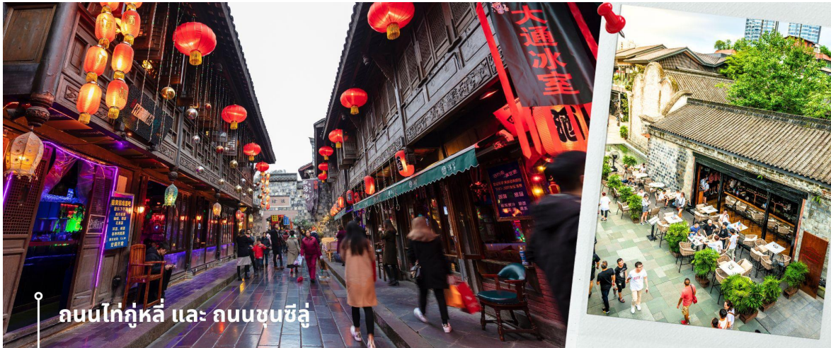
ถนนไท่กุ่หลี่ และ ถนนชุนซีลู่

จากนั้นให้ท่านให้อิสระกับการเลือกซื้อสินค้าของฝากที่ ถนนไท่กุ่หลี่ และ ถนนชุนซีลู่ ในย่านนี้เป็นถนนโบราณ ในอดีตเคยโรงงานผลิตผ้าไหมใหญ่ที่สุดในจีน ปัจจุบันได้เปลี่ยนเป็นถนนช้อปปิ้งแหล่งสวรรค์ของนักท่องเที่ยว เป็นถนนคนเดิน มีห้างสรรพสินค้าชื่อดัง มีร้านค้ามากกว่า 700 ร้านค้าที่เต็มไปด้วยสินค้าต่าง ๆ ทั้งร้านค้าแฟชั่น ร้านอาหารและโรงแรมนานาชาติมากมายซึ่งเป็นที่เที่ยวเชิงดูที่มีการเชื่อมต่อทางวัฒนธรรมท้องถิ่นที่เป็นแหล่งช้อปปิ้งและเป็นแหล่งร้านอาหารที่อร่อยต่าง ๆ มากมาย ซึ่งเป็นสถานที่เที่ยวของเชิงดูที่ทำให้เพลิดเพลินกับสินค้าแบรนด์เนมและแบรนด์จีน