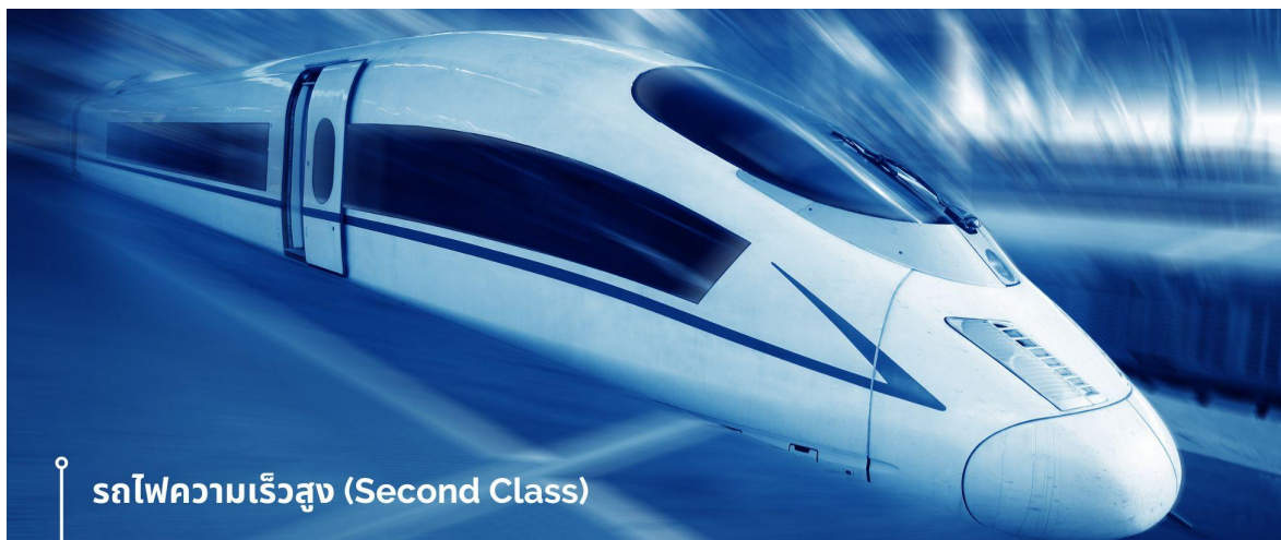
รถไฟความเร็วสูง (Second Class)

นำท่านเดินทางสู่สถานีรถไฟ เพื่อเดินทางด้วย รถไฟความเร็วสูง (Second Class)