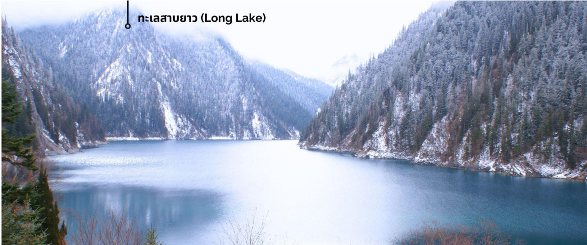
ทะเลสาบยาว (Long Lake)

ทะเลสาบที่ใหญ่ที่สุด สูงที่สุด และลึกที่สุดในจิวจ้ายโกว ด้วยเนื้อที่กว่า 581 ไร่ ความยาวกว่า 7 กิโลเมตร และลึกถึง 103 เมตร ทอดตัวโค้งเป็นรูปพระจันทร์เสี้ยว เนื่องจากหิมะบนภูเขาละลายลงมา น้ำในทะเลสาบสีฟ้าสวยงาม ล้อมรอบด้วยยอดเขาสูงชัน และต้นไม้ใหญ่ที่ปกคลุมด้วยหิมะ งดงามราวหลุดออกมาจากภาพวาด ความพิเศษในช่วงฤดูหนาว ทะเลสาบจะกลายเป็นน้ำแข็งหนากว่า 60 เซนติเมตร ทำให้นักท่องเที่ยวนิยมมาเล่นสเก็ตน้ำแข็งกันเป็นจำนวนมาก