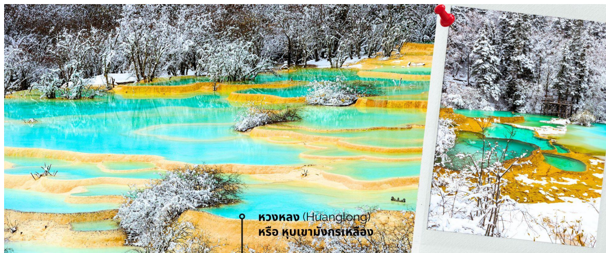
หวงหลง (Huanglong) หรือ หุบเขามังกรเหลือง

หวงหลง (Huanglong) หรือ หุบเขามังกรเหลือง (รวมค่ากระเช้าขึ้น-ลง หวงหลงและรถแบดเตอร์) ที่ได้รับการขึ้นทะเบียนเป็นมรดกโลก รายล้อมไปด้วยแอ่งน้ำสีฟ้าจำนวนมาก และภูเขาสูงใหญ่สลับซับซ้อน อุทยานหวงหลง (Huanglong Scenic and Historic Interest Area) หรือ หุบเขามังกรเหลือง แหล่งธรรมชาติที่อุดมสมบูรณ์บนเทือกเขา Minshan Mountains มีระบบนิเวศที่หลากหลาย ทั้งน้ำพุร้อน น้ำตก แอ่งน้ำหินปูน รวมถึงเป็นแหล่งของพืชพรรณนานาชนิด และสัตว์ป่าใกล้สูญพันธุ์อย่าง แพนด้ายักษ์ และ ลิงจมูกเชิดสีทอง เป็นต้น ที่สำคัญยังมีทัศนียภาพที่สวยงามทั้งราวกับเป็นดินแดนสวรรค์ ด้วยคุณสมบัติเหล่านี้ อุทยานหวงหลงจึงได้รับการขึ้นทะเบียนเป็นมรดกโลกโดยองค์การ UNESCO เมื่อปี ค.ศ. 1992