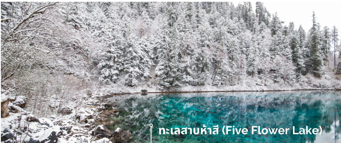
ทะเลสาบห้าสี (Five Flower Lake)

หนึ่งในจุดที่สวยงามและนักท่องเที่ยวแวะมาเยี่ยมชมชมเยื่อที่สวยที่สุด ตั้งอยู่ที่ความสูงเหนือระดับน้ำทะเลประมาณ 2,472 เมตร น้ำลึกประมาณ 5 เมตร น้ำใสจนเห็นพื้นด้านล่างของทะเลสาบ สีของผิวน้ำสวยงามแปลกตา โดยเฉพาะเมื่อยามแสงอาทิตย์สาดส่องกระทบผิวน้ำ สีของน้ำในทะเลสาบจะสะท้อนเป็นสีส้มถึง 5 เฉดสี สวยงามสะกดตา ซึ่งสาเหตุที่ทำให้เกิดสีสันต่างๆ นี้มาจากการสะสมของแร่ธาตุ และพืชน้ำชนิดต่างๆ โดยจะมีสีสันแตกต่างกันไปตามฤดูกาลและช่วงเวลา ยิ่งถ้ามาในช่วงฤดูหนาว ต้นไม้ริมทะเลสาบจะเต็มไปด้วยหิมะสีขาวตัดกับสีของทะเลสาบ ดูสวยงามแปลกตา