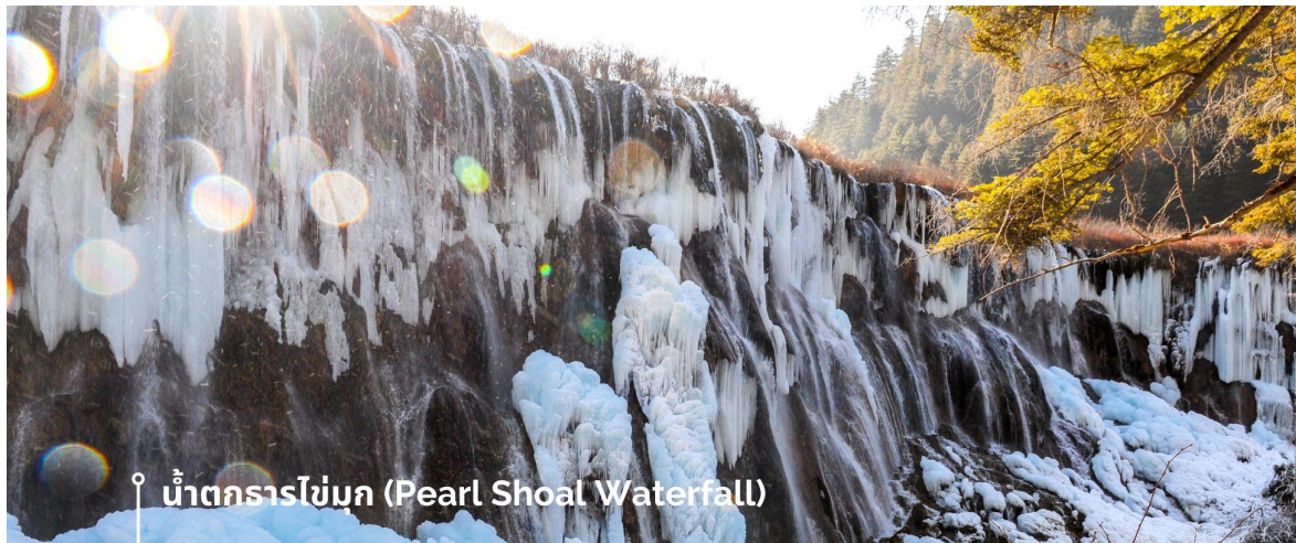
📍 น้ำตกกรรไกร (Pearl Shoal Waterfall)

จากแสงแดดที่สะท้อนกับละอองน้ำอีกด้วย หากได้มาในช่วงฤดูหนาว ก็จะได้เห็นหิมะเกาะตามต้นไม้ โขดหิน และถ้าอากาศหนาวมากๆ น้ำที่น้ำตกก็จะกลายเป็นน้ำแข็ง กลายเป็นประติมากรรมจากธรรมชาติที่สวยงาม