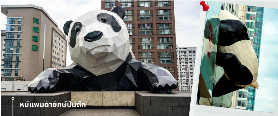
หมีแพนด้ายักษ์ป็นตึก

ป็นตึก และมีส่วนหัวที่โผล่พ้นออกมาจากอาคาร ทำให้เกิดภาพอันน่ารักและน่าประทับใจจากผู้ที่พบเห็นและนักท่องเที่ยว