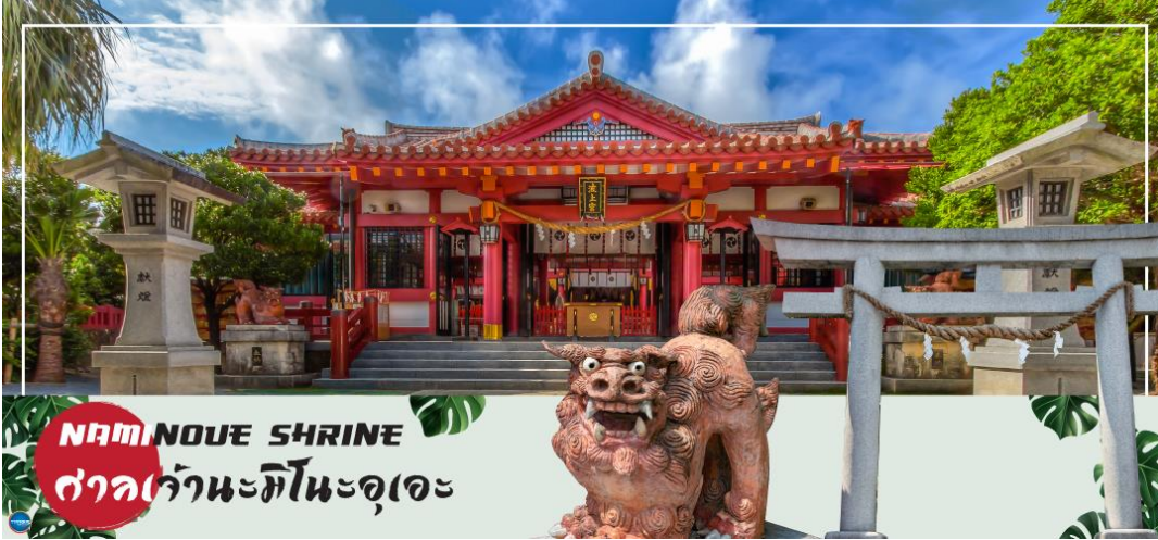
NAMINOUE SHRINE ศาลเจ้ามิโนะอุเอะ

วันที่สี่ ศาลเจ้านามิโนะอุเอะ - อาชิบิโน่า เอาท์เลตมอลล์ - ท่าอากาศยานนาสะ โอกินาว่า - ท่าอากาศยานดอนเมือง กรุงเทพฯ