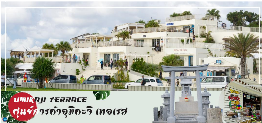
UMIKAJI TERRACE ศูนย์การค้าอุมิคะจิ เทอเรส

จากนั้นนำท่านสู่ ศูนย์การค้าอุมิคะจิ เทอเรส (UMIKAJI TERRACE) (ใช้เวลาเดินทางประมาณ 25 นาที) ศูนย์การค้าแห่งใหม่ที่สร้างอยู่บนเนินเขาลาดเอียงบนเกาะเซนกะจิมะ (Senagajima Island) ตั้งอยู่เลยจากรันเวย์สนามบินนาฮา (Naha Airport) เพียงไม่กี่ร้อยเมตรเท่านั้น จึงสามารถมองเห็นเครื่องบินไต่ในระยะใกล้มากราวกับกำลังบินเฉียดศีรษะไปเลยทีเดียว ภาพของอาคารสีขาวสะอาดตาหลายหลังที่ตั้งอยู่ลดหลั่นกันบนพื้นลาดเอียงตัดกับสีของท้องฟ้ากว้างและสีโคบอลต์บลูของน้ำทะเลดูโดดเด่นงดงามชวนให้เคลิ้มและปลอบประโลมจิตใจได้เป็นอย่างดี ซึ่งมีทั้งร้านช้อปปิ้ง ร้านอาหาร หรือแม้แต่มัคจุดถ่ายรูปมากมายของที่แห่งนี้