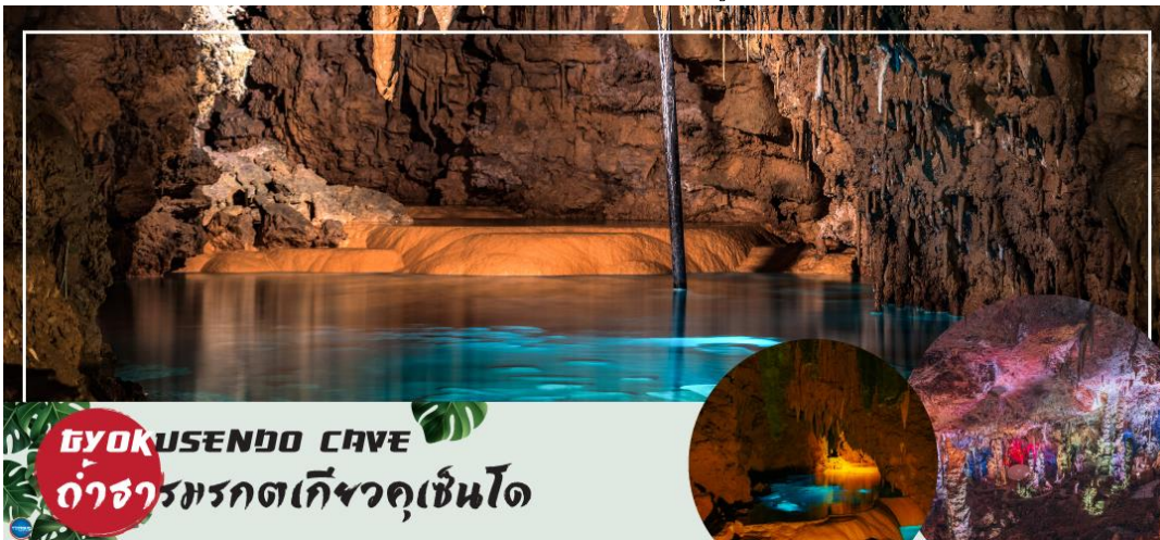
GYOKUSENBO CAVE ถ้ำจากรกตเก็จวคฺเซินโด

ไม่ได้ใช้แบบขึ้นรูป มีสีสันสดใส ด้วยฝีมือช่างผู้ชำนาญ ชมช่างทำแก้ว ในขณะที่ทำงานสร้างเครื่องแก้ว ที่เป็นการสร้างสรรค์ด้วยฝีมือของช่างแต่ละคน ชมห้องจัดแสดงผลงานเครื่องแก้ว และให้ท่านสามารถเลือกซื้อเครื่องแก้วที่ท่านถูกใจได้