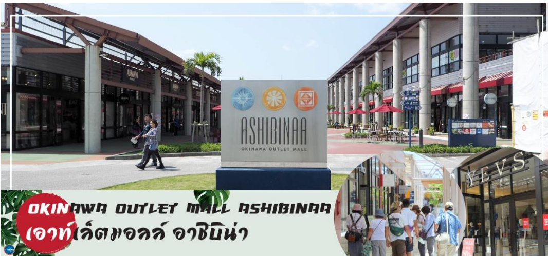
OKINAWA OUTLET MALL ASHIBINAA เอาท์เล็ตมอลล์ อาชิบิโน่า

เช้า รับประทานอาหารเช้า ณ ห้องอาหารของโรงแรม (5) นำท่านเดินทางสู่ ศาลเจ้านามิโนะอุเอะ (Naminoue Shrine) (ใช้เวลาเดินทางประมาณ 10 นาที) ตั้งอยู่ ณ บริเวณที่เป็นพื้นที่ศักดิ์สิทธิ์ที่ใช้ในการสวดภาวนาอธิษฐานต่อเทพเจ้าที่สถิตย์อยู่ ณ อาคารจักรเจ้าสมุทรโพ้นทะเลมาแต่ครั้งโบราณ ในอดีตชาวเรือที่เข้าออก ณ ท่าเรือนาสะ (Naha Port) ซึ่งขณะนั้นเป็นศูนย์กลางการแลกเปลี่ยนค้าขายกับนานาประเทศ ทั้งจีน ประเทศทางตอนใต้เกาหลี และชาวยามาโตะ มักจะแหงนหน้ามองขึ้นไปยังศาลเจ้าซึ่งตั้งอยู่บนหน้าผาสูงเพื่ออธิษฐานและแสดงความขอบคุณ ศาลเจ้านามิโนะอุเอะได้รับความเสียหายจากการรบในโอกินาวะ (Battle of Okinawa) เมื่อครั้งสงครามแปซิฟิก แต่ได้รับการบูรณะฟื้นฟูในเวลาต่อมาเมื่อสงครามสิ้นสุดลง ปัจจุบันนี้ได้กลายมาเป็นศูนย์กลางแห่งศาสนาชินโตในจังหวัดโอกินาวะ ชาวญี่ปุ่นมักจะมาไหว้ขอพรเกี่ยวกับธุรกิจการงานให้เจริญรุ่งเรือง ร่ำรวย และมาสะเดาะเคราะห์ให้พ้นโชคร้าย จากนั้นนำท่านสู่ เอาท์เล็ตมอลล์ อาชิบิโน่า (Okinawa Outlet Mall Ashibinaa) (ใช้เวลาเดินทางประมาณ 30 นาที) เอาท์เล็ตแห่งแรกในโอกินาวะ รวบรวมร้านค้าชั้นนำกว่า 100 ร้าน ทั้งเสื้อผ้าแฟชั่น สินค้าแบรนด์เนม นาฬิกา ข้าวของเครื่องใช้ ของเล่น ทุกร้านจัดเต็มทั้งสินค้ารุ่นเก่าและรุ่นใหม่ ลดราคากระหน่ำกว่า 30-80% ให้ได้เดินช้อปปิ้งตัวยหรีปกันอย่างจุใจ ภายใต้บรรยากาศสบายๆ สไตล์รีสอร์ทริมทะเล หากช้อปปิ้งเหนื่อยสามารถขึ้นไปทานอาหารที่ชั้น 2 มีอีกหลายร้านที่คอยให้บริการ