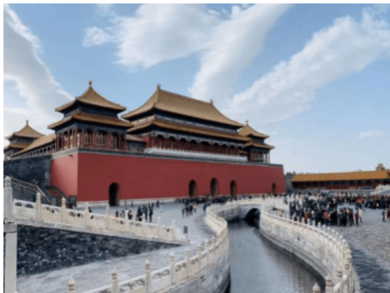
BJS01 The Legend of Beijing(HU)Mar2025

จากนั้นนำท่านเข้าเที่ยวชม พระราชวังกู้กงหรือพระราชวังต้องห้าม ซึ่งในอดีตเคยเป็นที่ประทับของจักรพรรดิแห่งราชวงศ์หมิงและราชวงศ์ชิงรวม 24 รัชกาล ภายในประกอบด้วยห้องต่างๆ ถึง 9,999 ห้อง บนเนื้อที่กว่า 720,000 ตรม.