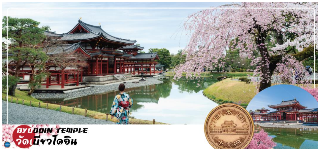
BYODOIN TEMPLE วัดเบียวโดอิน

วันที่สอง ท่าอากาศยานนานาชาติคันไซ โอซาก้า ประเทศญี่ปุ่น – เมืองเกียวโต – เมืองอุจิ – วัดเบียวโดอิน (จุดชมซากุระขึ้นกับภูมิอากาศ) – ถนนเบียวโดอิน โอมโตะซันโด (ถนนชาเขียว) – สะพานอุจิ – เมืองนาโกย่า – ซัปโปะงันซาคาเอะ