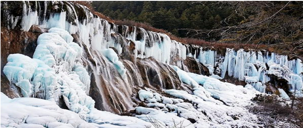
โดดเด่นสวยงามยิ่งนัก

ทะเลสาบห้าสี ทะเลสาบที่มีสีของน้ำแปลกตาโดยเฉพาะเมื่อยามแสงอาทิตย์ตกกระทบบนพื้นน้ำสีของน้ำในทะเลสาบจะเปล่งประกาย เป็นสีรุ้งดงามดังภาพวาดในจินตนาการของเหล่ากวีทั้งหลาย .....ชมม่านน้ำของ น้ำตกธารไข่มุก หรือ น้ำตกหน่อเยื่อกลางน้ำตกธารหินปูนขนาดใหญ่ที่สุด เป็นอีกหนึ่งจุดไฮไลท์ของจิวจ้ายโกวของรูปทรงของน้ำตกแผ่กว้างคล้ายพัดจีน กว้าง 310 เมตร และสูง 40 เมตร ฉากหลังของน้ำตกเป็นภูเขาขนาดสูงใหญ่ทำให้ภาพของน้ำตก