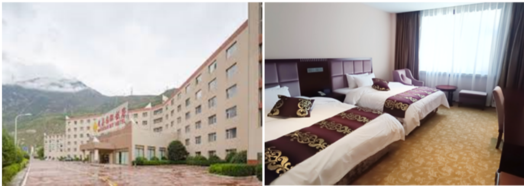
เทียบเท่า

ที่พัก MAOXIAN INTERNATIONAL HOTEL ระดับ 4 ดาว หรือ