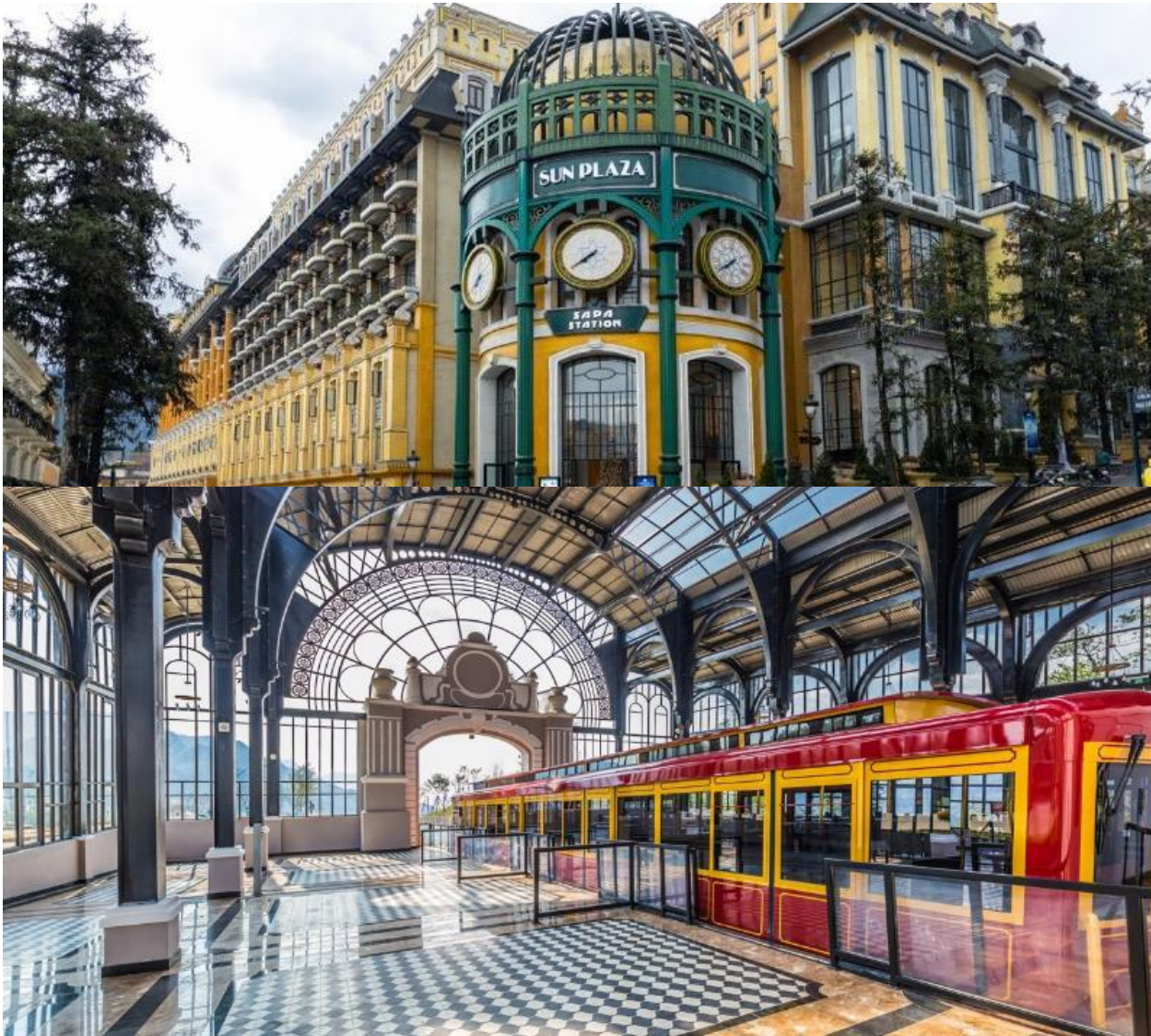
ระหว่างสองข้างทาง

นำท่าน นั่งรถรางเมืองซาปา จากสถานีซาปาสู่สถานีกระเช้า (ราคาทัวร์รวมค่ารถรางแล้ว) เพื่อขึ้นยอดเขาฟานซีปันระยะทางประมาณ 2 กิโลเมตร ท่านจะได้สัมผัสกับความสวยงามของธรรมชาติ