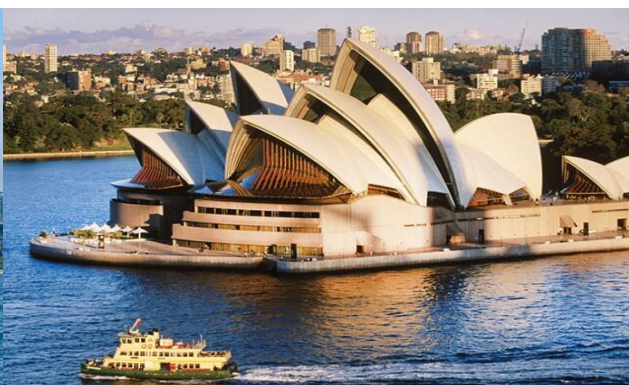
BIG...ENJOY AUSTRALIA 8D6N (QF) FEB - JUNE 2025

** ชำระค่าทัวร์ในนามบริษัท ไลออน ทราเวล จำกัด เท่านั้น **