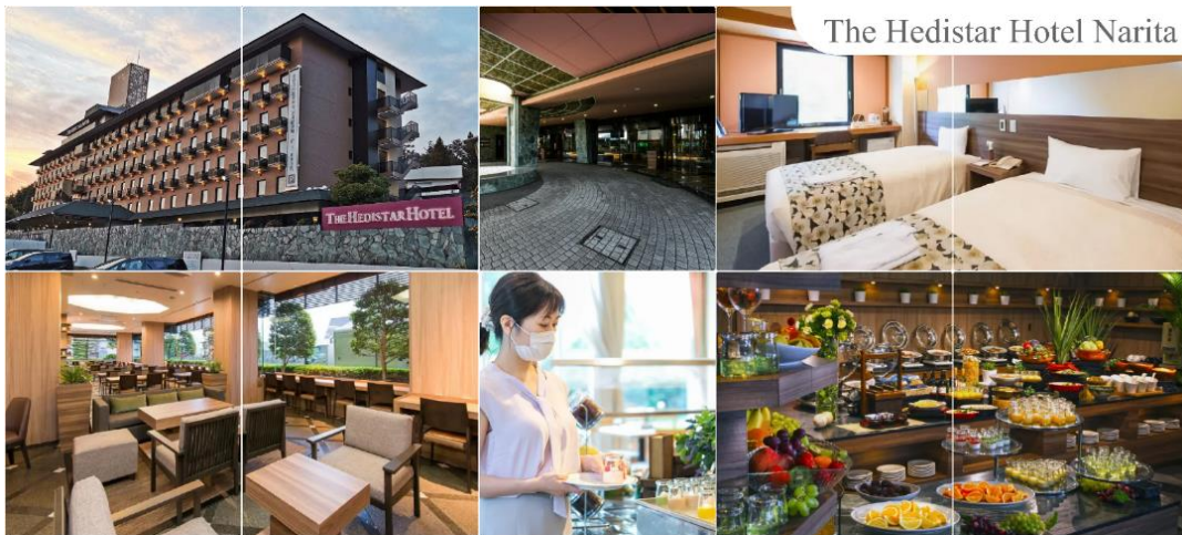
The Hedistar Hotel Narita

พักที่ THE HEDISTAR HOTEL NARITA หรือระดับเดียวกัน