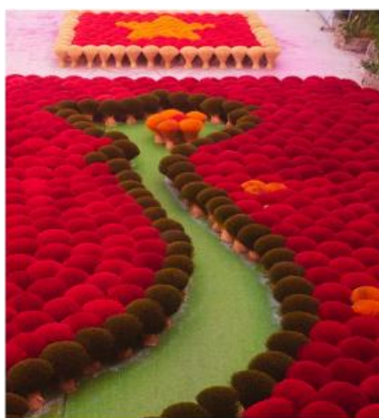
หมู่บ้านผลิตรูป Quang Phu Cau Village