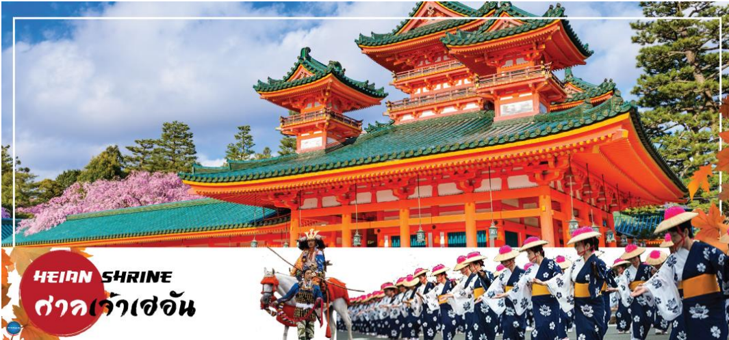
HEIAN SHRINE ศาลเจ้าเฮอัน

วันที่ห้า เมืองนาโกย่า – เมืองเกียวโต – ศาลเจ้าเฮอัน – การเรียนพิธีชงชาญี่ปุ่น – เมืองโอซาก้า – LALAPORT & MITSUI OUTLET PARK OSAKA KADOMA – ช้อปปิ้งชินไซบาชิ