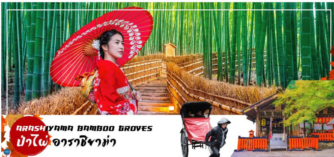
ARASHIYAMA BAMBOO GROVES ป่าไผ่ อาราชยามา

วันที่สอง ทำอากาศยานนานาชาติคันไซ โอซาก้า - เมืองเกียวโต - อาราชยามา - สวนป่าไผ่ - สะพานโทเก็ตสึเคียว - ถนนช้อปปิ้งอาราชยามา - เมืองคานาซาว่า