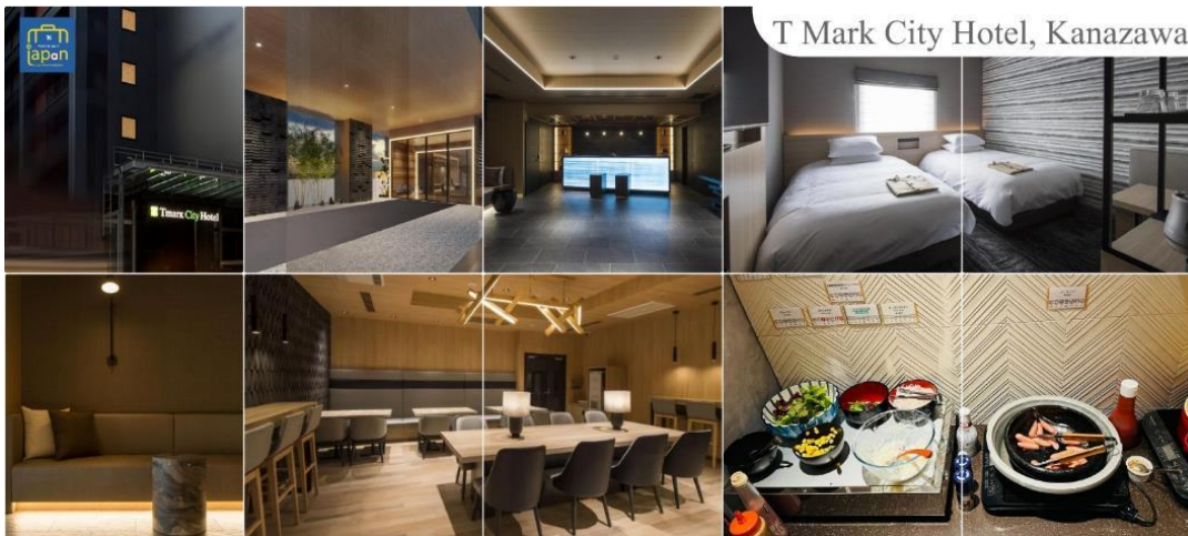
T Mark City Hotel, Kanazawa

เย็น รับประทานอาหารเย็นอิสระตามอัธยาศัย พักที่ T MARK CITY HOTEL, KANAZAWA หรือเทียบเท่าระดับเดียวกัน