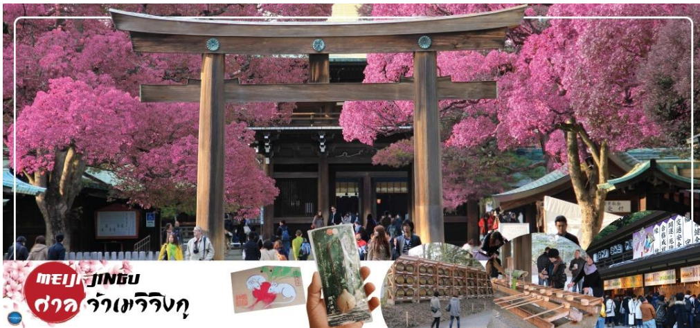
MEIJI JINGU ศาลเจ้าเมจิริงกุ

จากนั้นนำท่านเดินทางสู่ ศาลเจ้าเมจิ (Meiji Jingu) (ใช้เวลาเดินทางประมาณ 10 นาที) เป็นสถานที่ศักดิ์สิทธิ์ของกรุงโตเกียว สร้างขึ้นเพื่อสักการะพระจักรพรรดินีแห่งยุคเมจิ ที่ครองราชย์ ในสมัยปี 1867-1912 หลังจากที่พระจักรพรรดิเมจิสิ้นพระชนม์ ผู้คนในโตเกียวนั้นต่างเรียกร้องที่อยากจะทำศาลเจ้าเพื่อใช้สักการะพระจักรพรรดิเมจิ ขึ้นชื่อเรื่องการขอพรกับเทพเจ้า และเครื่องรางนำโชคของศาลเจ้าเมจิที่มีหลากหลายประเภท จึงมีลักษณะเฉพาะที่ไม่เหมือนที่อื่น ซึ่งสามารถเข้าไว้พกติดตัวได้อีกด้วย