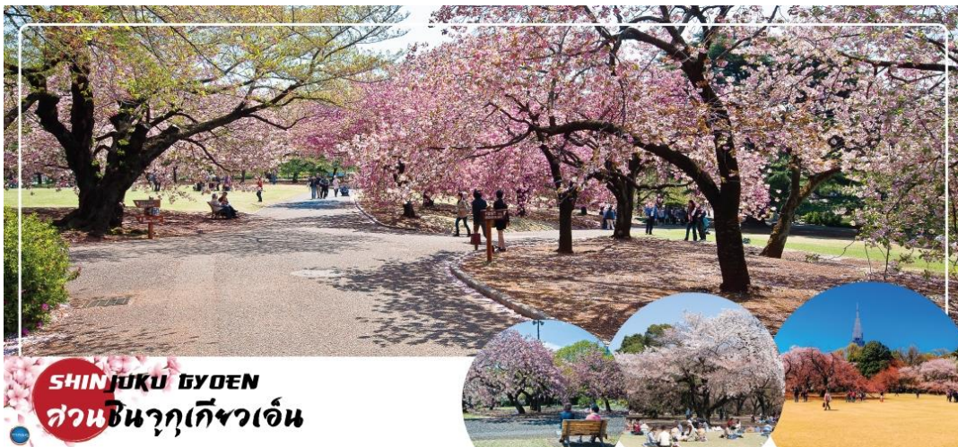
SHINJUKU GYOEN สวนชินจูกุเกียวเอ็น

วันที่สี่ เมืองนาริตะ – กรุงโตเกียว – สวนชินจูกุเกียวเอ็น (จุดชมซากุระขึ้นกับภูมิภาค) – ศาลเจ้าเมจิ – โทโยสุ เซนเดย์คุ บันไร – ย่านโอไดบะ – ห้างไดเวอร์ซิตี – เมืองนาริตะ