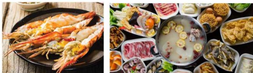
*ภาพที่ใช้เพื่อการโฆษณาเท่านั้น

เมนู สุดพิเศษ!! กุ้งแม่น้ำเผาทำนละ 1 ตัว ซาบูบุฟเฟ่ต์สไตล์เมียนมาร์ 🍴 อาหาร : 7 มื้อ