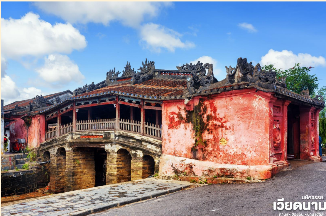
มหิศวรรษย์ เวียดนาม ดานัง • ฮอยอัน • บานาฮิลล์

นำชม Old House of Tan Skyบ้านโบราณ ซึ่งเป็นชื่อเจ้าของบ้านเดิมชาวเวียดนามที่มีฐานะดี ชมบ้านไม้ที่เก่าแก่และสวยงามที่สุดของเมืองฮอยอัน สร้างมากกว่า 200 ปี ปัจจุบันได้รับการอนุรักษ์ไว้เป็นอย่างดี การออกแบบตัวอาคารเป็นการผสมผสานระหว่างอิทธิพลทางสถาปัตยกรรมของจีน ญี่ปุ่น และเวียดนาม ด้านหน้าอาคารติดถนนเหวียนไทฮ็อกทำเป็นร้านบูติก ด้านหลังติดถนนอีกสายหนึ่งใกล้แม่น้ำทูโบนมีประตูออกไม้ สามารถชมวิวทิวทัศน์และเห็นเรือพายสัญจรไปมาในแม่น้ำทูโบนได้เป็นอย่างดี นำชม สะพานญี่ปุ่น ซึ่งสร้างโดยชุมชนชาวญี่ปุ่นเมื่อ 400 กว่าปีมาแล้ว กลางสะพานมีศาลเจ้าศักดิ์สิทธิ์ ที่สร้างขึ้นเพื่อสวดส่งวิญญาณมังกร ชม ศาลกวนอู ซึ่งอยู่บนสะพานญี่ปุ่นและที่ฮอยอันชาวบ้านจะนำสินค้าต่าง ๆ ไว้ที่หน้าบ้าน เพื่อขายให้แก่นักท่องเที่ยวท่านสามารถซื้อของที่ระลึก เป็นของฝากกลับบ้านได้อีกด้วย เช่น กระเป๋าโคมไฟ เป็นต้น