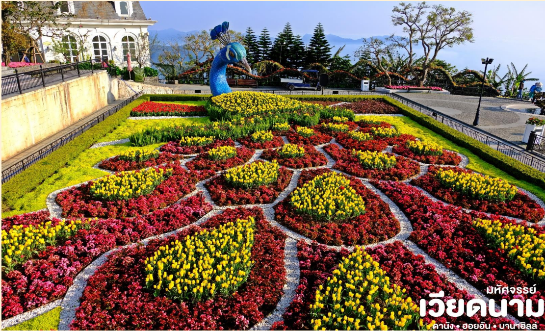
บริษัทจรรยา เวียดนาม ดานัง • ฮอยอัน • บานาฮิลล์

ชมเมืองฝรั่งเศส เป็นตึกออกแบบมาได้รับรยอากาศยุโรปแต่มาเจอได้ใกล้ๆเพียงแค่วีคานาม ลัดเลาะไปตามตรอกซอกซอย มีมุมถ่ายรูปเชคอินสวยๆหลายนมุม Le Jardin d' Amour เป็นสวนสวยสไตล์ฝรั่งเศส ที่มีทั้งดอกไม้ต้นไม้ มีมุมถ่ายรูปสวยๆ เต็มไปหมด รวมไปถึงมี โรงไวน์ Debay Wine Cellar อีกด้วยค่ะ เราเดินไปเที่ยวด้านในจะเป็นคล้ายๆ อุโมงค์ใต้ดินไว้บ่มไวน์ เป็นทางยาว เดินทะเลซมไปเรื่อยๆ ก็จะออกมาที่สวน นอกจากนี้ เดินไปไม่ไกลยังมีพระพุทธรูปองค์ใหญ่สีขาวสูงถึง 27 เมตรอีกด้วย