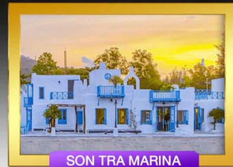
SON TRA MARINA