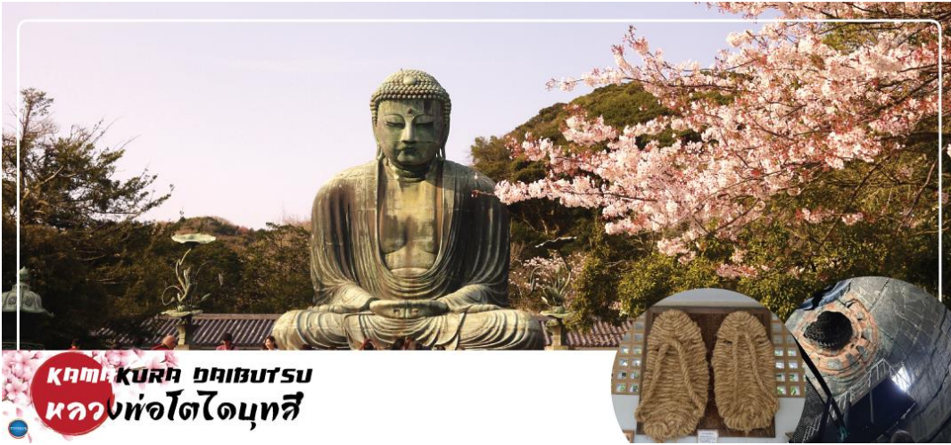
Kamakura Daibutsu หลวงพ่อดาโตะชิ

วันที่สอง ท่าอากาศยานนานาชาตินาริตะ – เมืองคามาคุระ – พระใหญ่โคโตะชิ คามาคุระ (จุดชมซากุระขึ้นกับภูมิภาค) – นั่งรถไฟคลาสสิกเอนเด็น – เมืองยามานาชิ – ออนเซ็น + ซาปูย์กัน