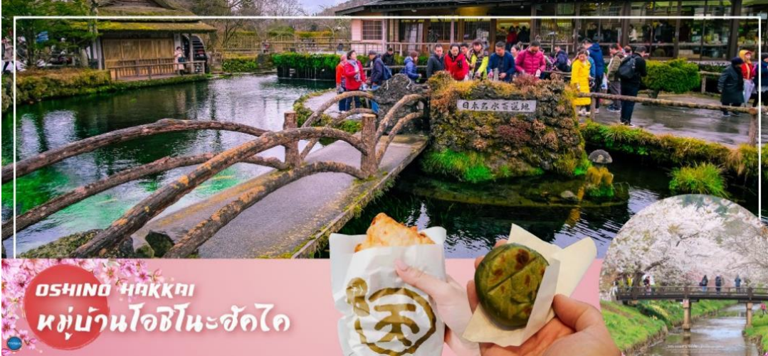
OSHINO HAKKAI หมู่บ้านโอชิโนะฮัคไค

วันที่สาม เมืองยามานาชิ – หมู่บ้านโอชิโนะฮัคไค (จุดชมซากุระขึ้นกับภูมิอากาศ) – การเรียนพิธีชงชาญี่ปุ่น – FUJIYAMA TOWER จุดชมวิวฟูจิซังแบบพาโนรามา – กรุงโตเกียว – ย่านโอไดบะ – ห้างไดเวอร์ซิตี – เมืองนาริตะ