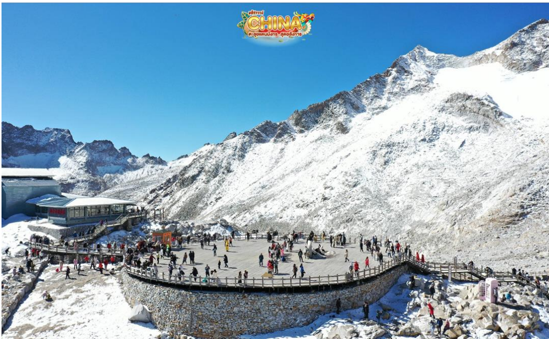
(หมายเหตุ: ปริมาณหิมะขึ้นอยู่กับสภาพอากาศ)

จากนั้น นำท่านเดินทางสู่ เขตอุทยานด้ากู่ปิงชว่น หรือ อุทยานสวรรค์ภูผาหิมะการ์เซียต้ากู่ปิงชว่น (Dagu Glacier National Park) ” โดยเปลี่ยนเป็นรถภายในอุทยาน ชมความงามของ 3 ทะเลสาบสวรรค์ที่